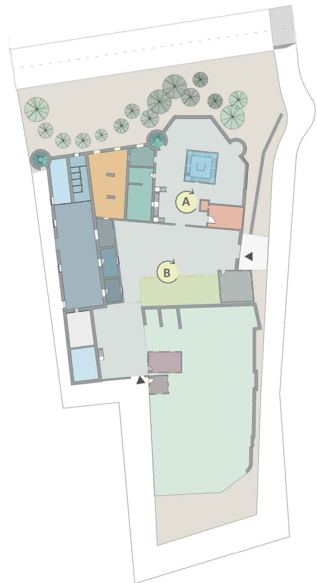
Piano terra: soluzione 1