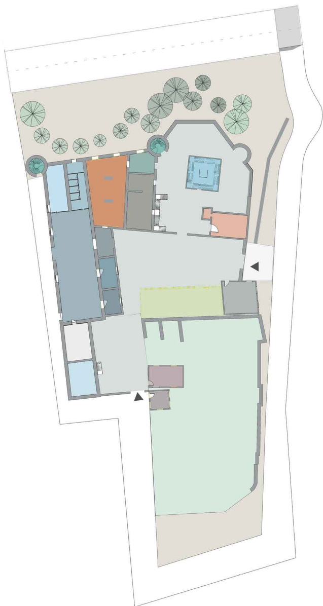
Piano terra: soluzione 2