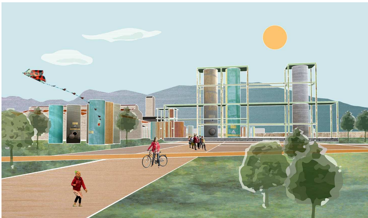
Suggerimento lotto Caffaro, sullo sfondo gli impianti dell'ex industria chimica.