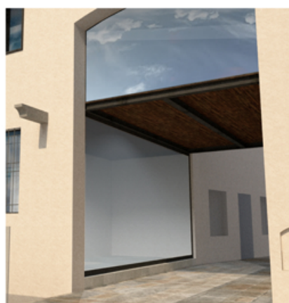
Immagine renderizzata di progetto che mostra il nuovo solaio in legno e travi "doppio t" in acciaio. Per garantire la corretta lettura dell'intervento non si ricorre alla realizzazione di controsoffittatura.