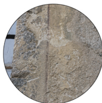
Intonaco accanto a finestra