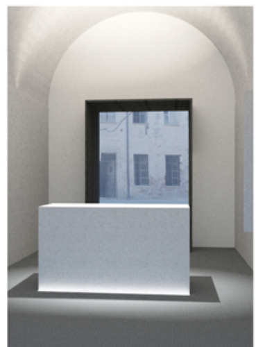
Immagine renderizzata della nuova apertura vista dall'interno.

Anche il prospetto sud vede la realizzazione di una nuova apertura al piano terra; al terzo piano, in corrispondenza di due serramenti mancanti, vengono montati due nuovi infissi (realizzati anche questi in metallo scuro).