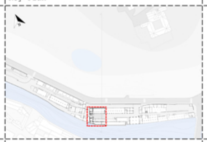
Lanificio Maurizio Sella Key Plan