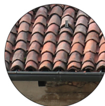
Manto di copertura in coppi e lattoniere. Orditura in legno