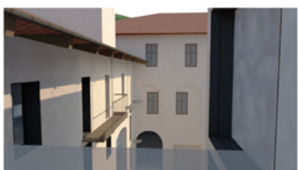
A. Vista di progetto

Al piano secondo la nuova terrazza panoramica permette una doppia vista sul cortile e sul torrente Cervo.