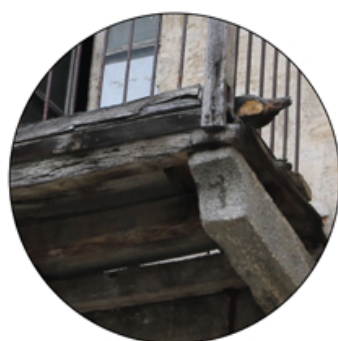
Balcone: assito in legno su mensole di granito