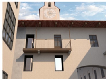
Particolare della facciata sud: renderizzazione

Il prospetto sud vede l'apertura di nuove finestre, funzionali all'apporto di luce all'interno dei nuovi ambienti. Tali finestre sono aperte in corrispondenza delle originarie aperture, tamponate nel corso del XX sec.