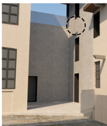
B. Vista di progetto

Si immagina che la porzione di parete scoperta dal nuovo intervento di parziale demolizione sia trattata in maniera tale da poter leggerne la differenza rispetto al resto della facciata.