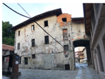
Fotografia del prospetto nord.

L'osservazione del prospetto nord permette di capire che la struttura muraria si costituisce di pietre (con tutta probabilità provenienti dall'attiguo Torrente Cervo) e di mattoni pieni.