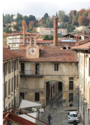
Fotografia del prospetto principale scattata dall'andadora".

Il prospetto sud domina il cortile interno, delimitandolo centralmente insieme alle altre due maniche. L'orologio che sormonta la copertura è stato restaurato in tempi recenti. Questa facciata mostra i segni evidenti delle diverse trasformazioni l'edificio ha subito nel corso del XX secolo.