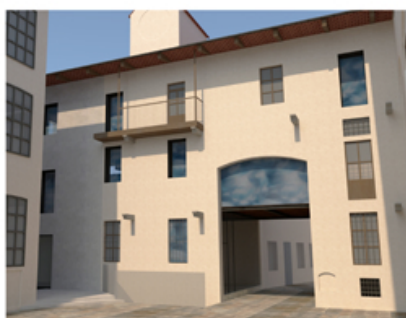
A. Vista di progetto

I nuovi collegamenti verticali (corpo scale con ascensore) sono utili a permettere percorsi maggiormente fluidi all'interno dell'edificio. La parziale demolizione della manica sud permette di ricavare un nuovo spazio esterno che fungerà da area di ingresso al locale caffè/bookshop. Le scale presenti in prossimità del passaggio che attraversa la casa sono demolite per far spazio ad una sala del bookshop. Questa sala è delimitata dall'esterno con una nuova parete vetrata.