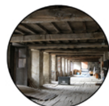
Fotografia dell'ordito che caratterizza il soffitto del salone del primo piano.

La struttura portante perimetrale è in muratura di pietra. Questo tipo di strutture è tipico di quelle fabbriche costruite anteriormente al 1820. I solai sono in legno con struttura portante costituita da travi non squadrate con sovrastante orditura di travetti in legno e pavimentazione in tavolato di castagno.