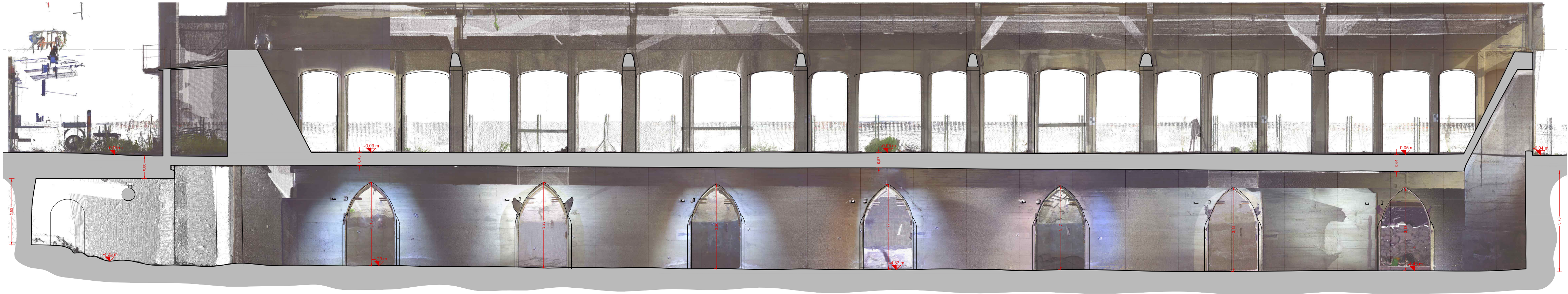
Sezione architettonica con immagine ortoproiettata