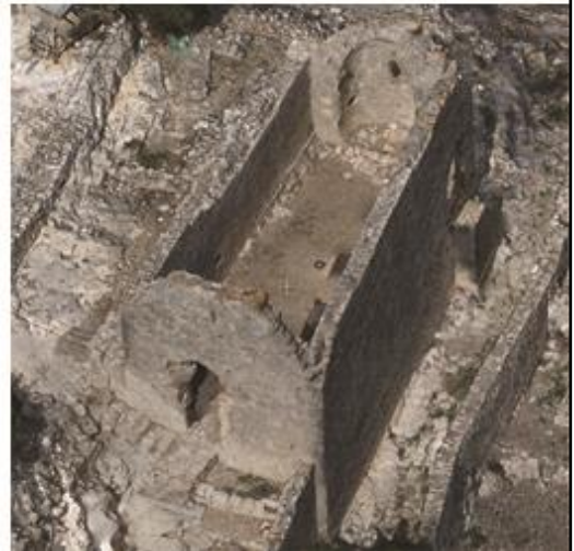
Elaborazione della mesh texturizzata ottenuta in 3DReshaper con viste di dettaglio del modello digitale navigabile realizzato dalle immagini dei voli effettuati con l'esacottero.