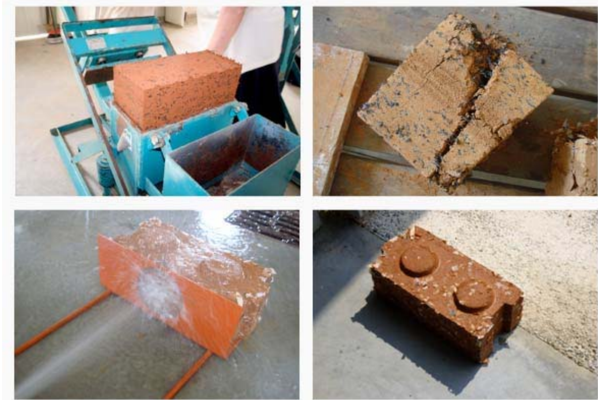
La réalisation des blocs