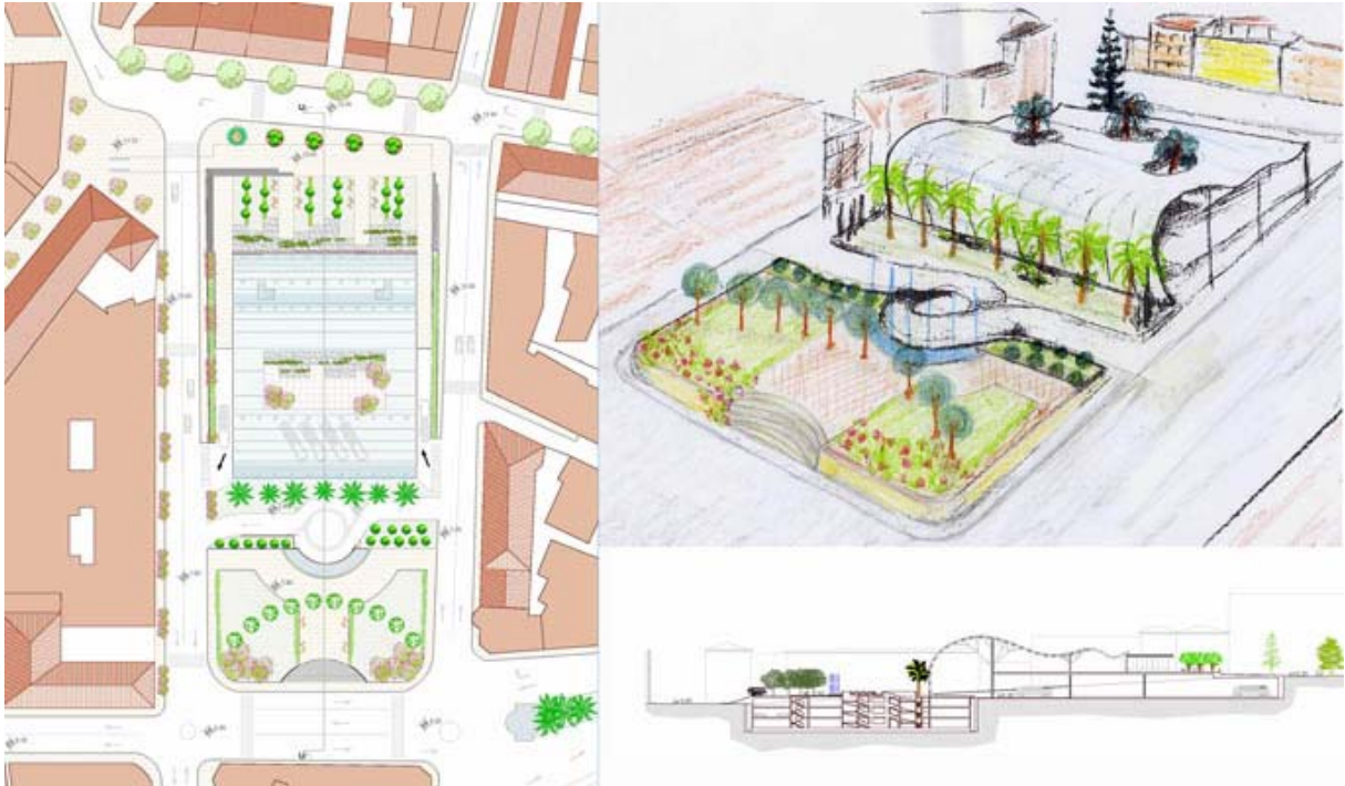
Conception du projet, vu assometric et section