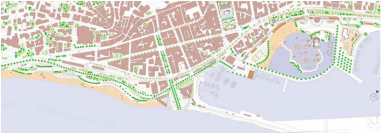
Conception du projet

Cette réunification importante entre les deux parties de la ville pourrait s'effectuer à travers une réciproque interconnexion urbaine des volumes et des fonctions.