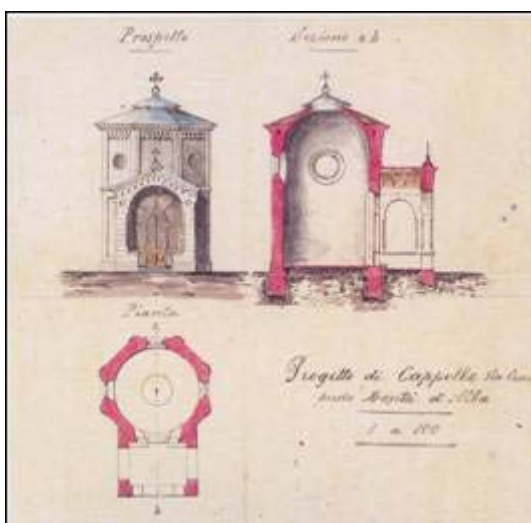
Disegno progettuale delle cappelle della Via Crucis