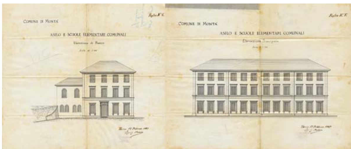
Prospetto frontale e laterale del Palazzo delle Scuole elementari