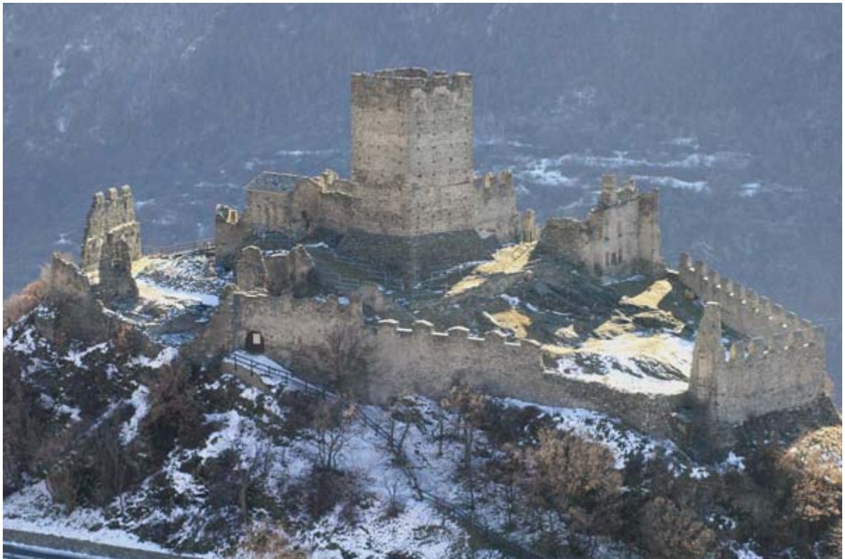
Vue nord-ouest du château de Cly

Le château de Cly est placé sur un promontoire dans la commune de Saint Denis. Édifié autour du XI siècle il présente une structure de base qui caractérise les modèles des châteaux primitifs. Actuellement cette structure est en ruine, mais on arrive encore à lire son histoire, puisque son évolution s'est cristallisée avec son abandon dans le '600.