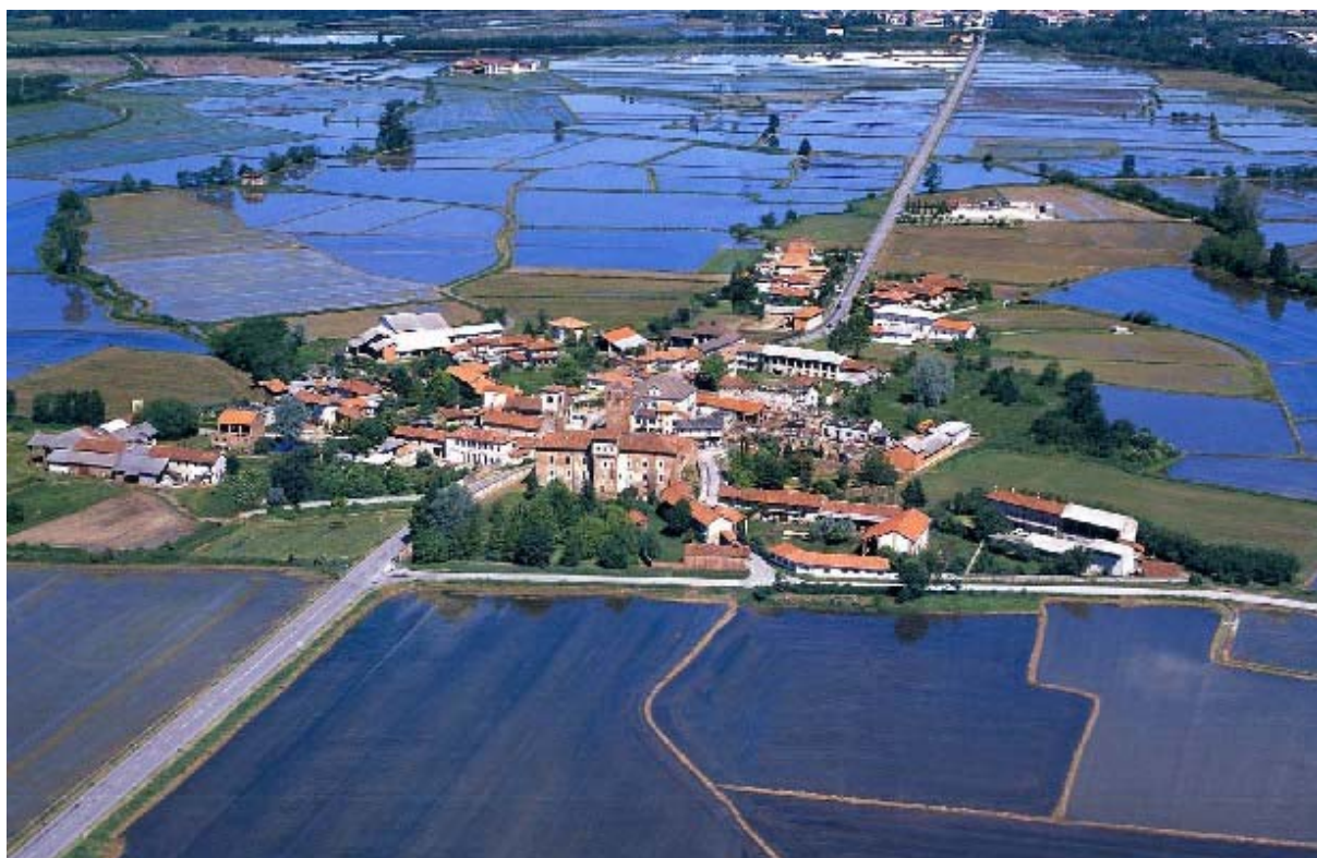
Le village de Balocco de l'haut

Dans la troisième partie on a développé le projet de valorisation du domaine. On a déterminé des itinéraires touristiques et culturels inhérents l'archéologie des eaux, les châteaux de plaine, uniques en Italie, et les vacheries historiques, témoins du progrès agricole. Chaque itinéraire a été accompagné par une diligente mise en fiche des constructions historiques et architectoniques visibles.