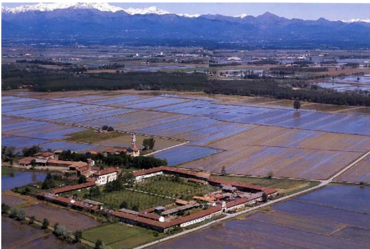
La vacherie historique de Vettigné de l'haut

La quatrième partie concerne l'évaluation du projet et l'analyse des plus actuelles et efficaces stratégies économiques pour la valorisation du domaine. On a choisi un « intervent-type » pour un édifice appartenant à chaque itinéraire : pour le premier parcours on a projeté la récupération de la maison du gardien des eaux de Monformoso, près du Canale Cavour; pour le deuxième parcours j'ai caractérisé les châteaux de Balocco, et pour le troisième parcours on a projeté la restauration et la valorisation de la vacherie historique de Vettigné.