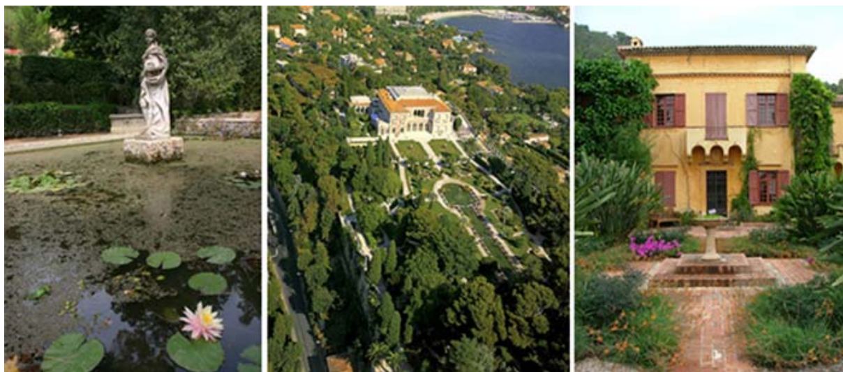
Esempi di giardini: Serre de la Madone a Mentone, Villa Ephrussi a St. Jean Cap Ferrat, Val Rahmeh a Mentone

Il nostro studio si è focalizzato sulla Riviera Francese durante il periodo tra Otto e Novecento: l'analisi comparata di mappe corografiche del Contado di Nizza e carte geografiche odierne ha permesso di capire forma e sviluppo degli insediamenti nei centri più importanti della Riviera, legati alla morfologia dei siti e all'influenza del mare, fondamentale per dare una giustificazione al sorgere di giardini. Si possono contare nell'ambito di costa studiata circa sessanta giardini, molti dei quali andati distrutti durante le due guerre mondiali, altri inaccessibili perché di proprietà privata. Attraverso la lettura strutturale di alcuni di essi si è cercato di creare una classificazione secondo un'analisi impostata su vari aspetti: la forma, lo stile e la collocazione sul territorio. Importante è stato capire la provenienza e la formazione culturale dei proprietari quali illustri personaggi, fra cui scrittori e artisti con la passione del giardino, ufficiali di guerra in pensione con l'unico scopo di ritirarsi in una realtà più serena, esponenti di ricche famiglie con indole stravagante e collezionisti di piante esotiche provenienti da terre lontane.