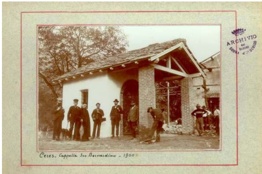
Cappella di San Bernardino a Ceres (1900)

Sulla base del materiale consultato e analizzato è stata redatta una scheda articolata e analitica, per ciascun edificio religioso. Per ogni fabbricato vengono date informazioni sulla storia dell'edificio e sui dati catastali; seguono la collocazione geografica e l'analisi dello stato attuale descritto sia testualmente sia attraverso il rilievo fotografico. Quando è stato possibile reperirla è stata riportata anche la documentazione fotografica storica.