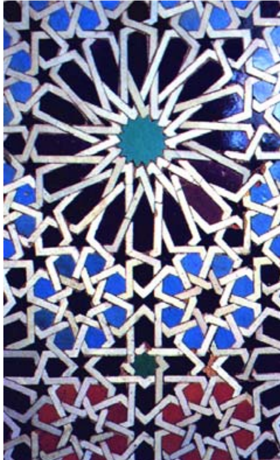
Particolare Zelliges

-SINTESI ED ELABORAZIONE DEI DATI I dati raccolti messi in relazione e organizzati secondo i parametri prima chiariti, hanno originato i tipi principali : medina; edifici sacri e pubblici (considerati come appartenenti ad un unico tipo vista la compresenza delle due funzioni, sacra e pubblica, all'interno dello stesso spazio fino al 1912); abitazioni e zelliges (mosaici). -APPROFONDIMENTI FOCALIZZATI Nel corso dell'indagine è risultato utile sviluppare più a fondo il "tema-tipo" degli zelliges perché particolarmente esplicitanti gli esiti del nostro studio.