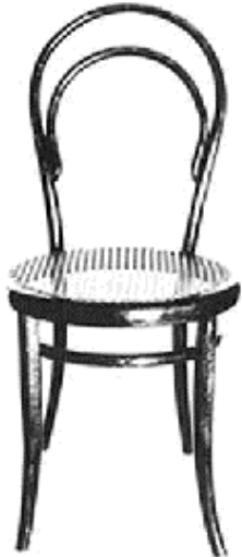
Sedia n° 14, Michael Thonet, prod. Gerbruder Thonet, 1855

Che cosa significa un'opera di architettura? Essa è un'operazione di selezione, di astrazione di alcuni aspetti dell'abitare che hanno trovato convenzionalmente nel tempo una serie di attribuzioni connotative e significati connotati, i quali a loro volta vengono riuniti per fare l'oggetto che è un'opera d'arte.