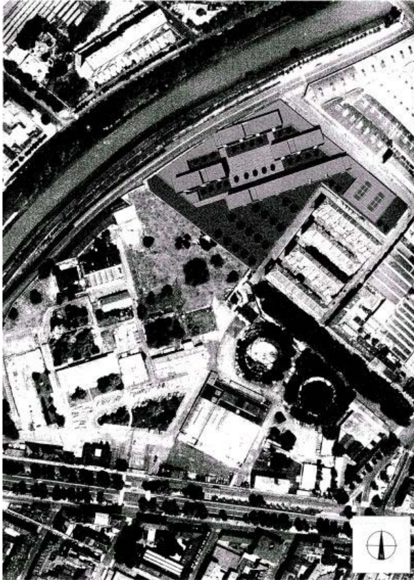
Foto aerea con inserimento coperture in progetto

Si è fatto riferimento alla contingent claims analysis e al modello esponenziale di Cox, Ross e Rubinstein, strumenti che hanno permesso, attraverso la modellizzazione dell'incertezza, di considerare la flessibilità manageriale. Sono state proposte a titolo esemplificativo due diverse opzioni: l'investimento alternativo a rischio nulla e la modifica della destinazione del progetto. Tali opzioni hanno permesso di applicare la teoria e di costruire un modello che, debitamente collaudato, potrebbe rientrare tra i criteri decisionali da affiancare alla tradizionale analisi costi-ricavi.