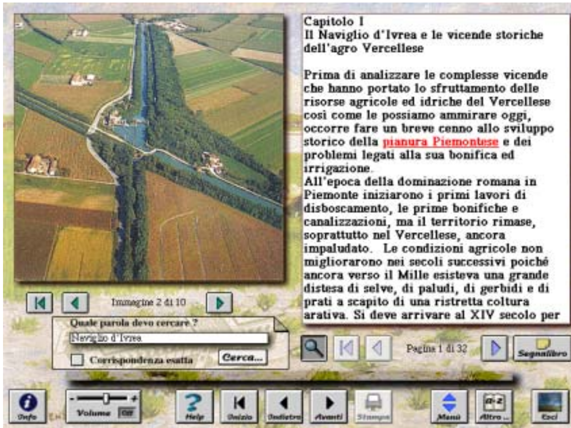
Parte 1 - Le vicende. Schermata principale

Ci sembra interessante accennare anche alla possibilità di sovrapporre alle cartine geografiche che a varie scale seguono il percorso del Naviglio d'Ivrea, i lucidi contestuali che approfondiscono alcuni tematismi del territorio preso in considerazione. La carta delle precipitazioni medie annuali, la carta dell'uso dei suoli o dei principali corsi d'acqua non sono solo uno spunto per arricchire lo studio della zona irrigata dal Naviglio d'Ivrea, ma servono, a nostro avviso, a portare il fruitore dell'opera ancora più vicino al complesso ecosistema dell'agro Vercellese.