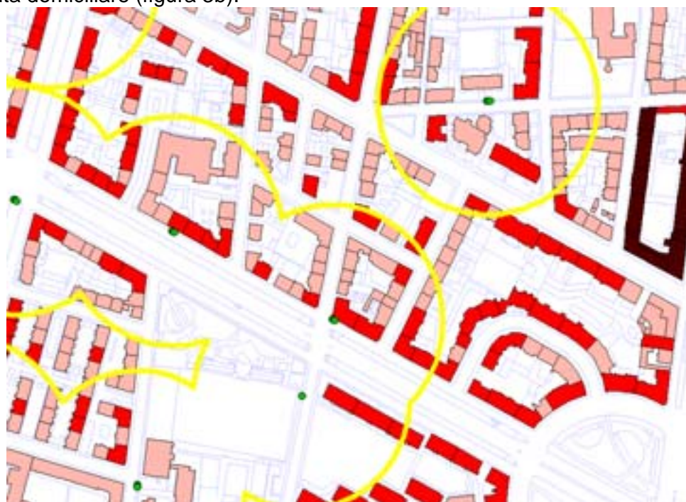
Figura 3a - Produzione di rifiuti cartacei per condominio e raccolta differenziata stradale