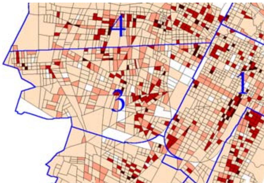
Figura 2 - Aree di maggiore produzione di rifiuti all'interno delle Circoscrizioni L'analisi può inoltre spingersi oltre, considerando come unità spaziali di analisi le cellule condominiali. In tal modo è possibile verificare l'accessibilità alle attrezzature stradali di raccolta differenziata (figura 3a), oppure individuare puntualmente la disponibilità di aree scoperte interne agli isolati (cortili, parcheggi, etc.), di facile accesso, dove possa essere opportuno allocare strutture di raccolta dedicate per la raccolta domiciliare (figura 3b).