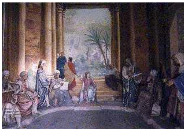
Cappella XII, La Disputa di Gesù nel Tempio, interno.

Il Sacro Monte si presenta oggi completamente modificato rispetto all'idea originaria. Gli sconvolgimenti apportati durante il secolo XIX ne alterano la composizione scenografica incrementando, grazie anche ad una maggiore sensibilità verso la scenografia naturale del Sacro Monte, gli aspetti legati alla partecipazione attiva ed emotiva del pellegrino, scandita dal continuo scambio tra il ruolo dell'attore e quello dello spettatore. Il tema stesso del Sacro Monte passa dall'esaltazione Mariana alla rappresentazione del Rosario. Così all'interno della Via Sacra, costituita oggi da 23 cappelle, si ritrovano oltre ai cinque misteri gaudiosi, dolorosi e gloriosi, ispirati al Nuovo Testamento, temi religiosi di varia natura: due episodi della vita di Sant'Eusebio, uno di ispirazione vetero-testamentaria, cinque temi dai vangeli apocrifi. Della "Via del ritorno" invece, realizzata affinché i pellegrini non ripercorressero al contrario la via del Rosario e per fornire un ulteriore momento di riflessione attraverso la narrazione delle storie di Santi Martiri o eremiti, oggi non rimangono che cinque cappelle.