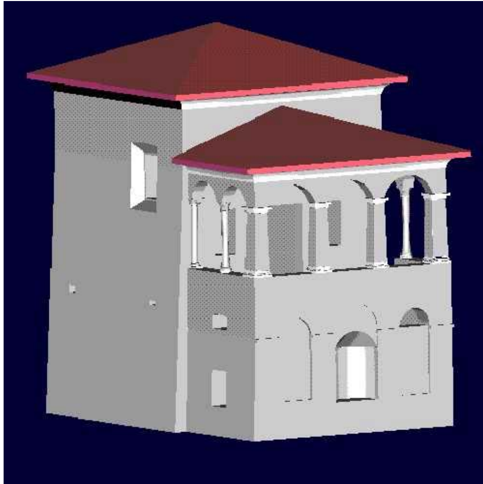
Cappella I, Il Martirio di Sant'Eusebio, modello tridimensionale.