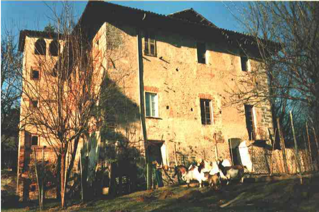
La casa del rettore: prospetto sud-est

degli spazi abitativi, secondo modelli segnalati nei territori di Verzuolo e, di nuovo, di Saluzzo.