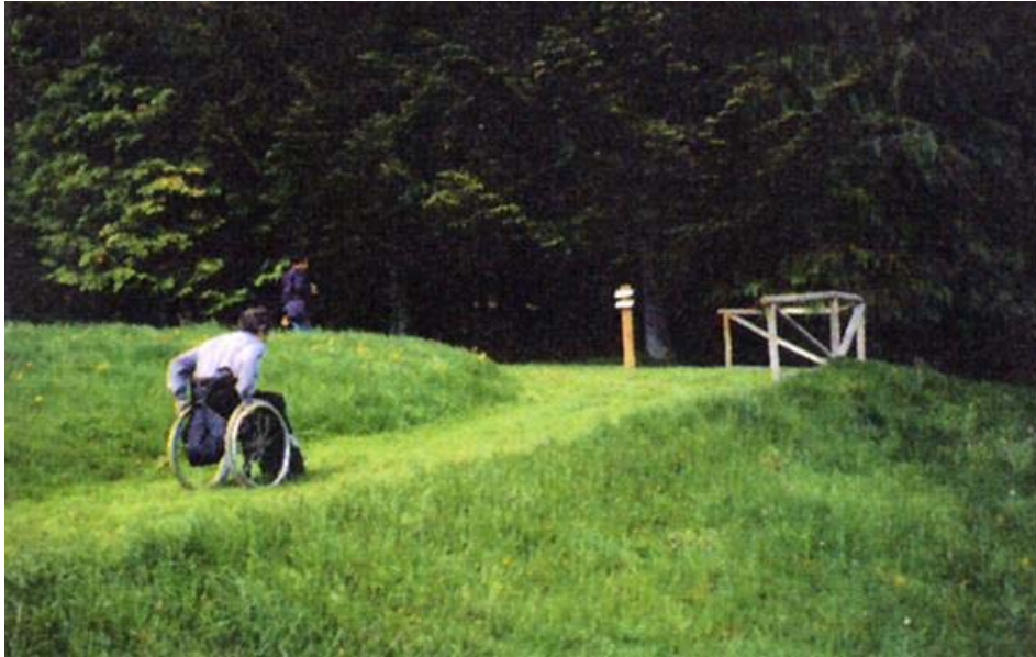
Park of the Orecchiella covered accessible to the motor disabili - deep grassy improved with stabilization of the bottom. Each "accessible" natural area is on file, with short one description of the specific intervention.