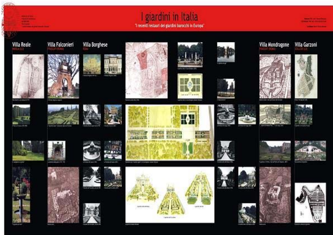
Fig. 3 I giardini italiani (tavola grafica)

All'interno di questo studio sono stati anche compresi i giardini borromei all'Isola Bella (VB), che nonostante non siano stati interessati, nel corso dei secoli, da interventi di restauro, costituiscono un importante esempio di "buona manutenzione".