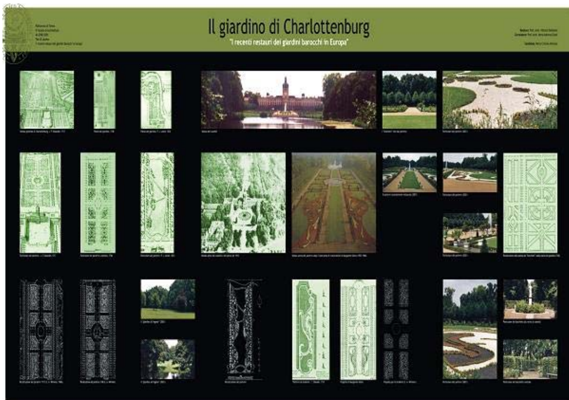
Fig.1 I giardini di Charlottenburg (tavola grafica)

A supporto di un'analisi generale, sono stati scelti alcuni esempi. I casi esaminati hanno riguardato per lo più i restauri più noti a livello internazionale; sono stati infatti analizzati i giardini di Versailles e di Vaux le Vicomte in Francia, i giardini di Hampton Court e quelli di Ham House in Gran Bretagna, il giardino di Het Loo in Olanda e quello di Charlottenburg in Germania.