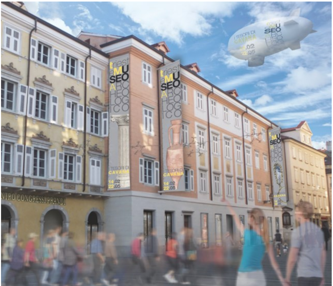
Fig. 3: Proposta per lo scenario vincente (turistico) - un nuovo museo archeologico