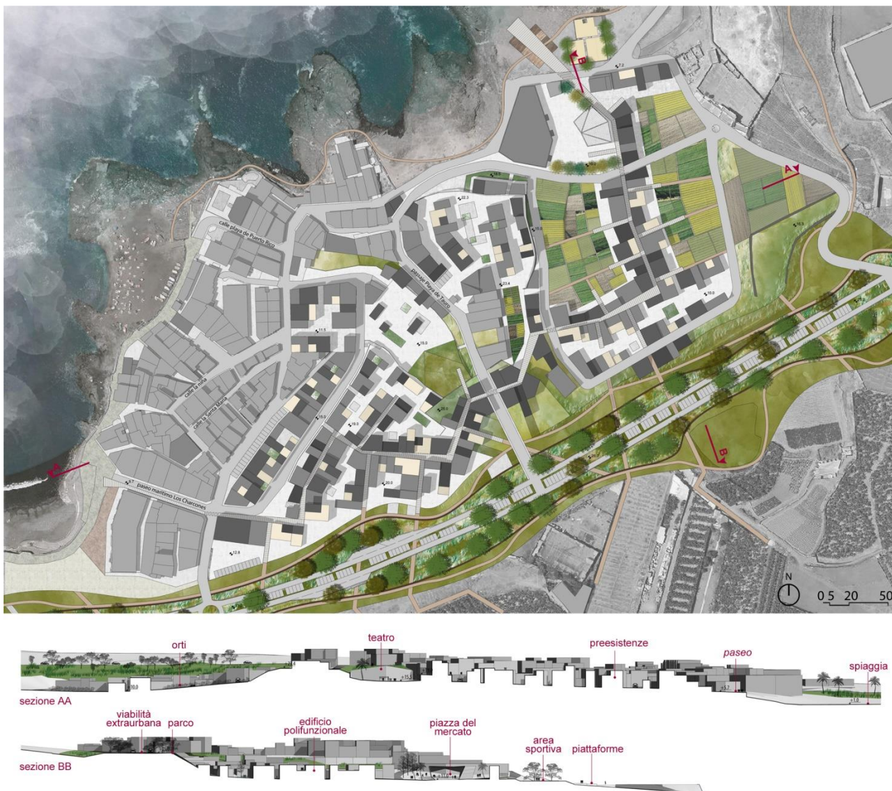
Figura 3_ Sviluppo della soluzione progettuale a fronte della valutazione dei tre scenari. All'alternativa vincente (scenario 1) sono stati integrati alcuni elementi emersi positivamente dalla valutazione dello scenario 2.

Il risultato ottenuto è un progetto di trasformazione del Puertillo che nasce dall'analisi del contesto e dalle effettive relazioni presenti tra gli attori e che inoltre si configura come un progetto aperto, ossia come una base che può essere modificata e implementata nel tempo in relazione all'evoluzione delle condizioni. La flessibilità che contraddistingue questo tipo di approccio lo pone quindi direttamente in contrapposizione con il progetto nella sua accezione tradizionale, che invece ha bisogno di condizioni di background stabili per realizzarsi.