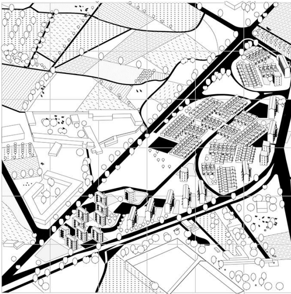
Figure 2_Fuencarral B nel 1956