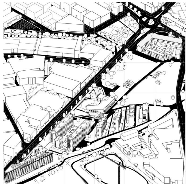
Figure 1_Fuencarral B nel 2015

Il secondo è dedicato ad una proposta di metodo. Si indagano le potenzialità della Teoria dei Giochi quale strumento di analisi ed eventuale supporto ai processi decisionali propri all'urbanistica. Questa parte del lavoro è stata formalizzata in un gioco da tavolo che simula la contrattazione tra gli agenti responsabili dello sviluppo urbano, traducendo in termini semplificati e facilmente usufruibili la modellizzazione matematica propria alla Teoria e il concetto di soluzione quale condizione di equilibrio formulata dal matematico J. Nash.