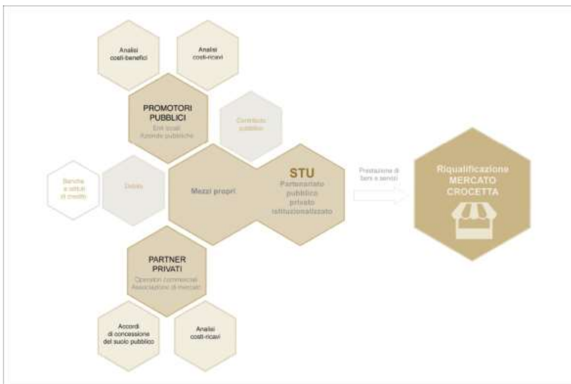
Fig.3 - Schema che riassume la strategia di finanziamento dell'intervento.