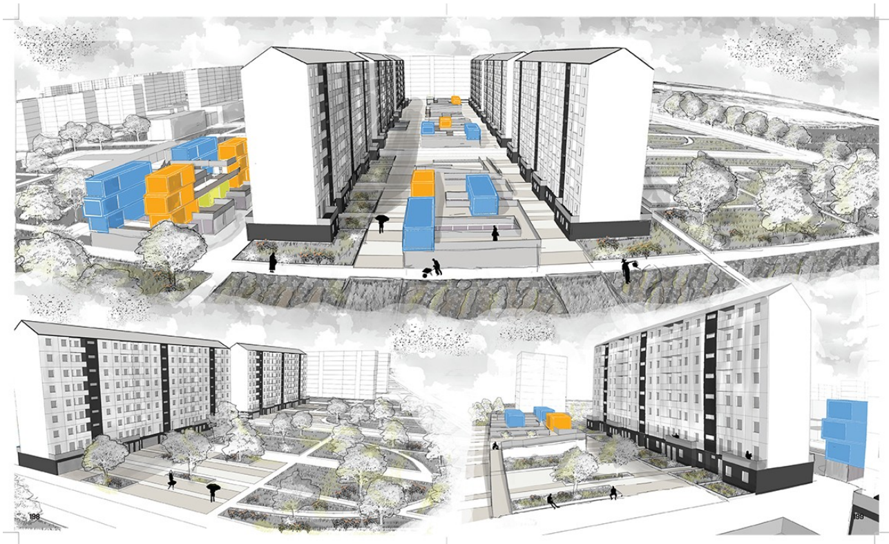
5 LOCALI-6 LOCALI-7 LOCALI-AUTORIMESSA-VUOTI-ALLOGGIAMI-CORPI SCALA

elaborare alternative, da cui attingere per realizzare le più opportune scelte territoriali, in relazione alle priorità stabilite e condivise con i destinatari del progetto.