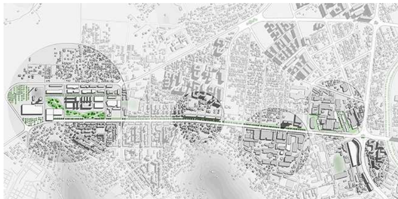
Individuazione dei tasselli di sviluppo compresi tra il complesso di Kombinat ed il fiume Lana

Parallelamente è stata condotta un'analisi riguardante il Piano Strategico del 2013 per comprendere quale sia la politica urbana attuale di Tirana così da confrontarla con quella dedotta dalle trasformazioni avviate, fornendo indicazioni fondamentali per delineare la nostra proposta urbana per il futuro della città. Le criticità evidenziate nel processo di trasformazione attuale di Tirana, ci hanno portato a riflettere su una proposta alternativa a quella in atto. L'occasione si è presentata tramite la collaborazione con il Politecnico di Tirana, all'interno del quale il nostro relatore in loco, forte delle sue conoscenze dovute all'operatività sia accademica che professionale, ci ha incentivato ad osservare le potenzialità ancora in ombra ma di rilevanza fondamentale per il futuro della città.