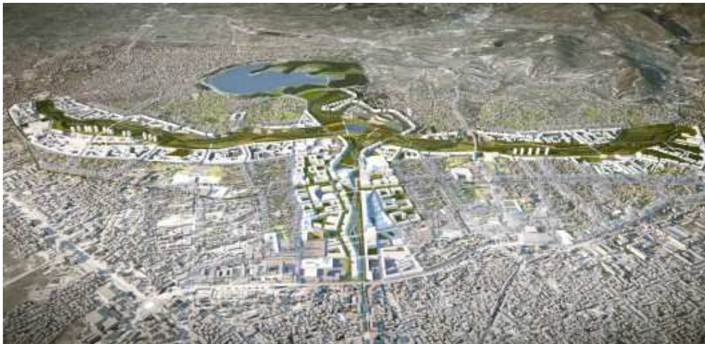
Masterplan della proposta dello studio londinese Grimshaw 2013 (www.grimshaw-architects.com)

In secondo luogo vengono considerati ed analizzati gli studi urbani che, nel corso dell'ultimo ventennio, si sono susseguiti e hanno condotto analisi per comprendere gli aspetti di maggior impatto e rilevanza della città. Il materiale ricavato è stato rielaborato con l'obiettivo di definire una tassonomia delle reali problematiche e quali, di conseguenza, le proposte e le soluzioni per ogni specifico aspetto della città. Tramite lo studio della trasformazione in atto, si prende in considerazione la politica urbana, analizzandola attraverso una lettura critica, per comprendere la direzione verso la quale Tirana si sta muovendo e per dedurre intenzioni e volontà.