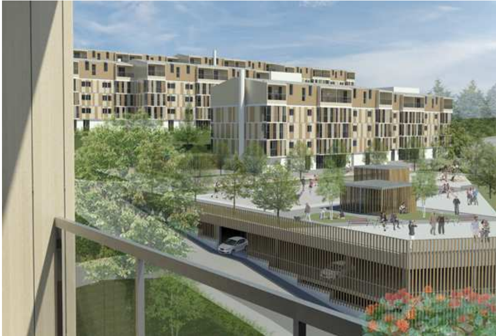
Vista fotorealistica della riqualificazione dal piano sopraelevato

La riqualificazione dell'involucro ha permesso di ipotizzare la realizzazione di nuovi alloggi in copertura, grazie ad una sopraelevazione con prefabbricazione leggera in legno. Data la volontà di un miglioramento globale della qualità del complesso, si è pensato inoltre alla risistemazione del suolo prevedendo la progettazione di luoghi di socializzazione attualmente non presenti.