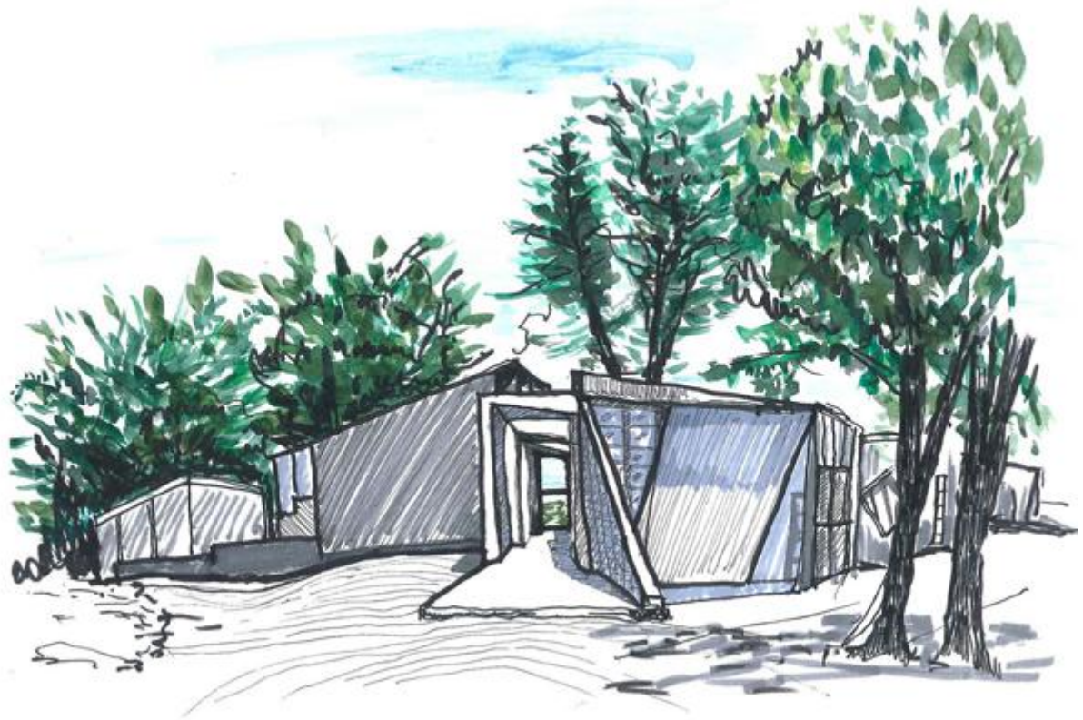
Hospederia nella Ciudad Abierta

La tesi di doppia laurea è l'esito dell'accordo bilaterale tra il Politecnico di Torino e la Ponteficia Universidad Católica di Valparaiso (Esquela de Arquitectura de Valparaiso). Nel 2012 ho partecipato ad un programma internazionale di doppia laurea in Cile, presso la PUCV, per consolidare e approfondire le mie conoscenze nel campo dell'architettura.