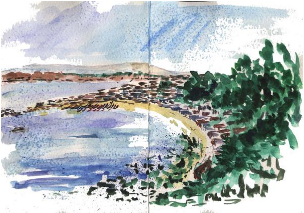
Schizzo della costa di Hòrcón

La mia permanenza, durata 18 mesi, mi ha permesso di stare a contatto con una nuova realtà e di apprendere nuove teorie nel pensare e nel vivere l'architettura della Scuola. Instaurando un ottimo rapporto (mediante le varie attività collettive) con i professori e con i miei compagni, ho imparato ad abbracciare più nel profondo la filosofia della Esquela de Arquitectura de Valparaiso (EAD). Amereida, La Ciudad Abierta, la Travesia e l'approccio progettuale sono i punti centrali del manifesto sul quale la Scuola di Valparaiso si fonda e si identifica fra le tante scuole di architettura.