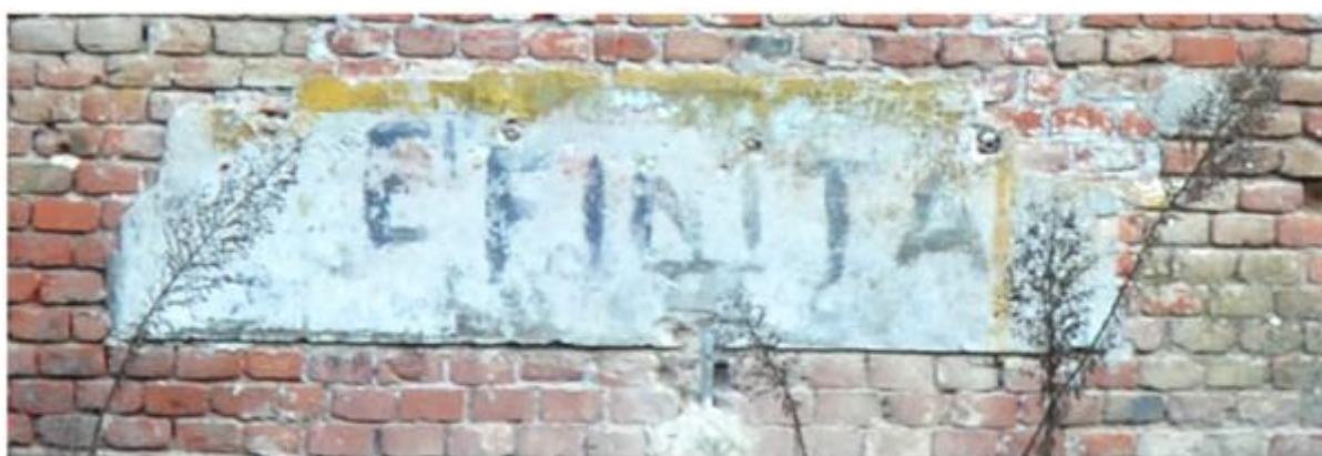
Figura 2: Scritta sul fronte sud della Polveriera San Tommaso.

Nel 1949 lo scrittore Guareschi notava la scritta "Correre!" 1 , sul muro di un edificio, insieme alla natura dinamica della Cittadella: le sue parole oggi risuonerebbero assurde e legate a un altro tempo e a un altro luogo. Oggi, sul fronte sud della Polveriera San Tommaso, nell'unico pezzo d'intonaco ancora integro compare una scritta ben diversa, che recita: "E' finita" (fig. 2).