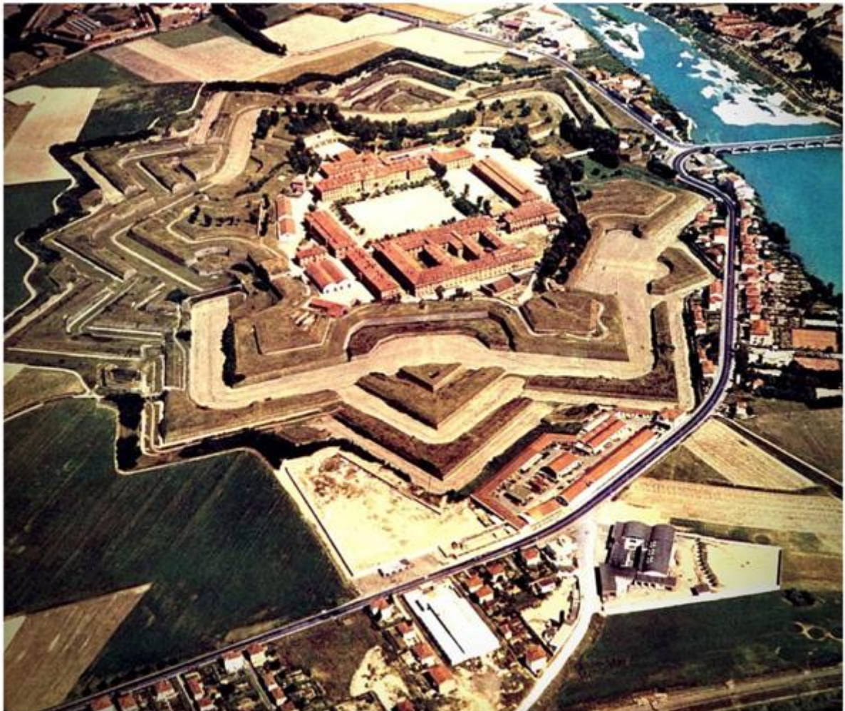
Figura 1: La Cittadella di Alessandria vista dall'alto.

La Cittadella di Alessandria (fig. 1), rappresenta nella sua complessità un interessante spunto di riflessione sul tema della valorizzazione e gestione dei beni demaniali in Italia.