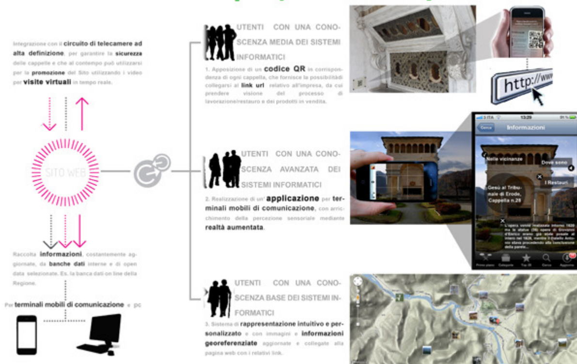
Figura 3 Esempi di promozione attraverso l'utilizzo delle Information Communication Technologies (ICTs) per la promozione del Sito UNESCO e del territorio di pertinenza, favorendo l'esplorazione e la visita dei luoghi in maniera accattivante e personalizzata con il supporto delle nuove tecnologie