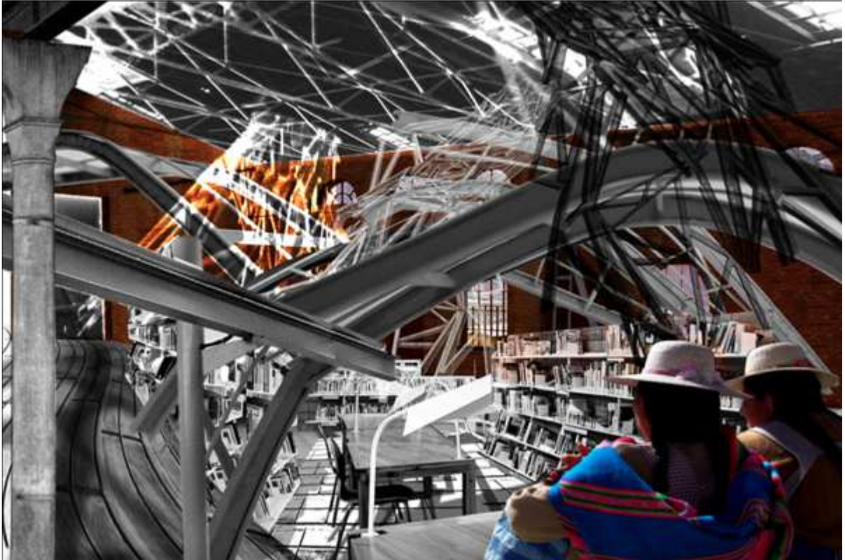
Foto-montaggio culturale, interno del capannone 7

La tesi propone svilupparsi in linea con il processo architettonico che è stato seguito durante laboratorio di progettazione con il Taller AVB. Si tratta di un quaderno di appunti di quel “laboratorio d’idee” che ha fatto parte della struttura teorica del progetto.