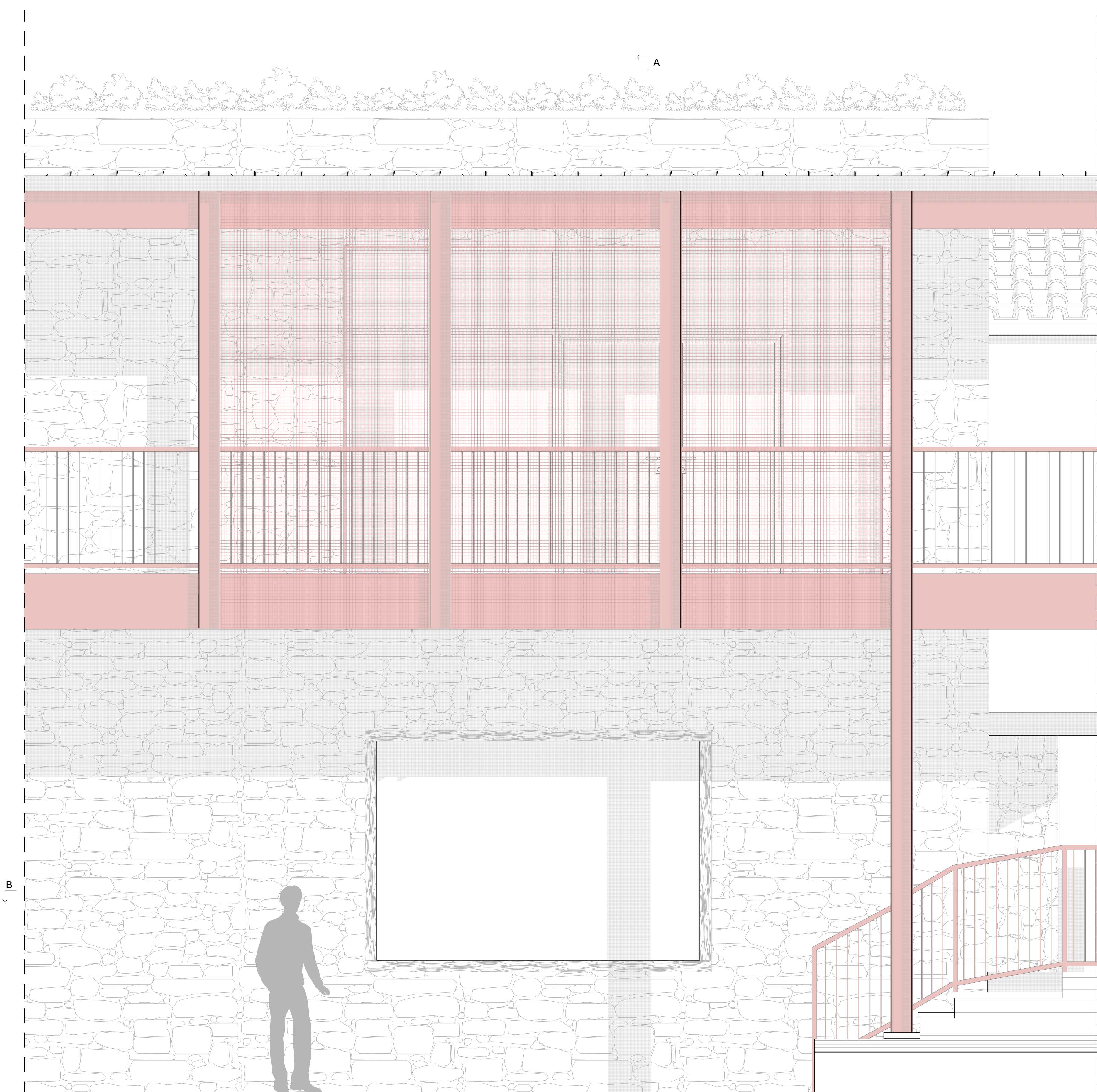
STRALCIO DI PROSPETTO