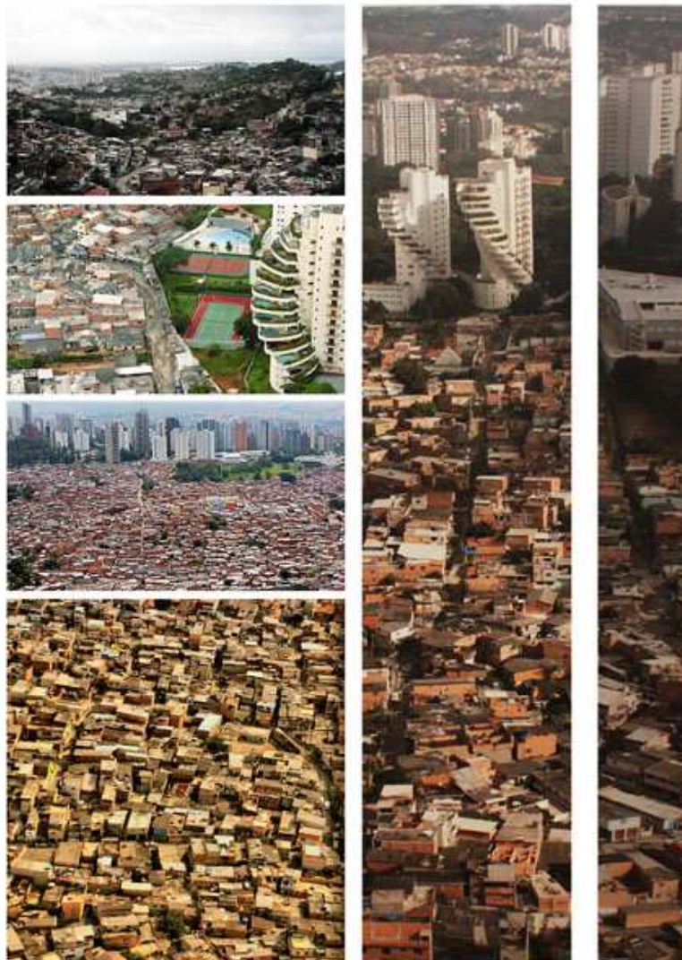
Immagini di insediamenti precari

Per l'elaborazione del progetto di tesi ho avuto modo di collaborare (a São Paulo, Brasile) con la Cooperative d'ingegneri e architetti "Integra", e la Prefeitura di Guarulhos in particolare con la Secreteria di Habitação .