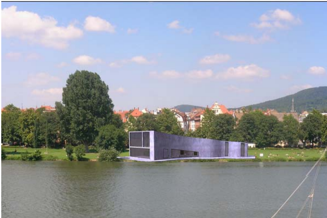
Vista sud del Monolite in estate, fase di non galleggiamento

Interamente realizzato in cemento Flowstone, a getto unico, è leggero, galleggiante e trasparente. Il monolite, luogo di incontro e di eventi culturali, nei mesi invernali galleggia sul prato inondato dalle periodiche esondazioni del fiume.