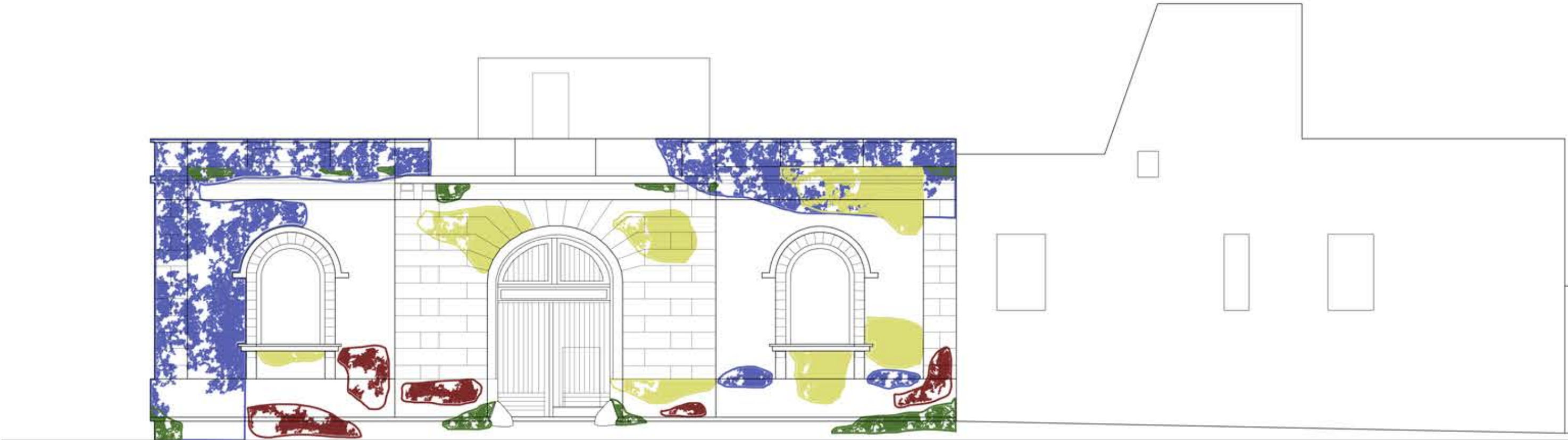
PROSPETTO SUD scala 1:100