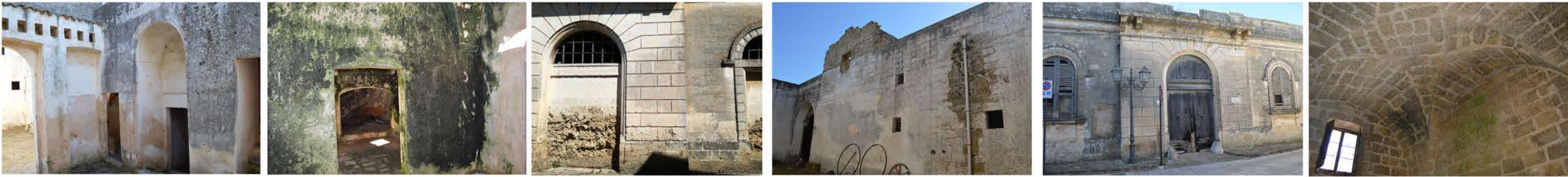
PROSPETTO A-A' scala 1:100