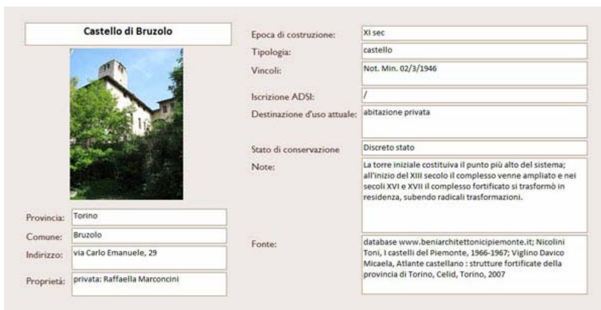
Un esempio di schedatura di edificio

Considerata la stretta connessione tra i problemi relativi alla tutela e al riuso delle dimore storiche e il tema della loro conoscenza, è sembrato utile eseguire una campagna di studio e censimento delle dimore presenti sul territorio piemontese, in modo da approfondire e comprendere la presenza e la distribuzione di questi beni nella regione.