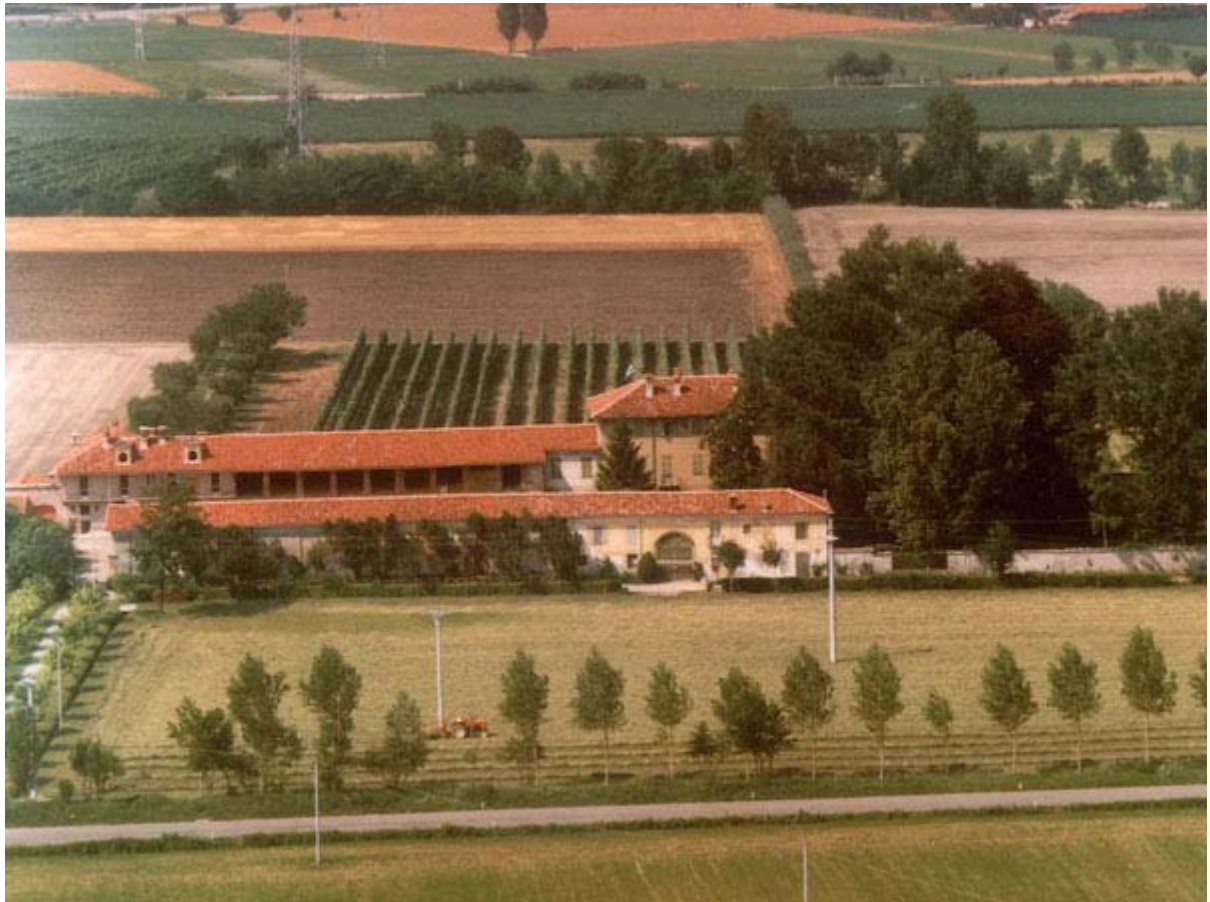
Una delle dimore presenti sul territorio pinerolese

La situazione di questo territorio è stata dunque oggetto di interesse sia per la considerazione dello stretto rapporto di connessione tra i beni , ma anche per la valutazione dell'importanza di ricercare funzioni compatibili all'interno di dimore che non abbiano un utilizzo consono. Infine, per la considerazione dei rischi che l'incuria nei confronti di un singolo bene si riversi inevitabilmente sull'intero contesto di appartenenza, soprattutto in assenza di un adeguato provvedimento vincolistico, come in questo caso appunto, che assicuri una tutela integrata non solo delle singole dimore presenti ma anche dell'intero territorio ad esse connesso.