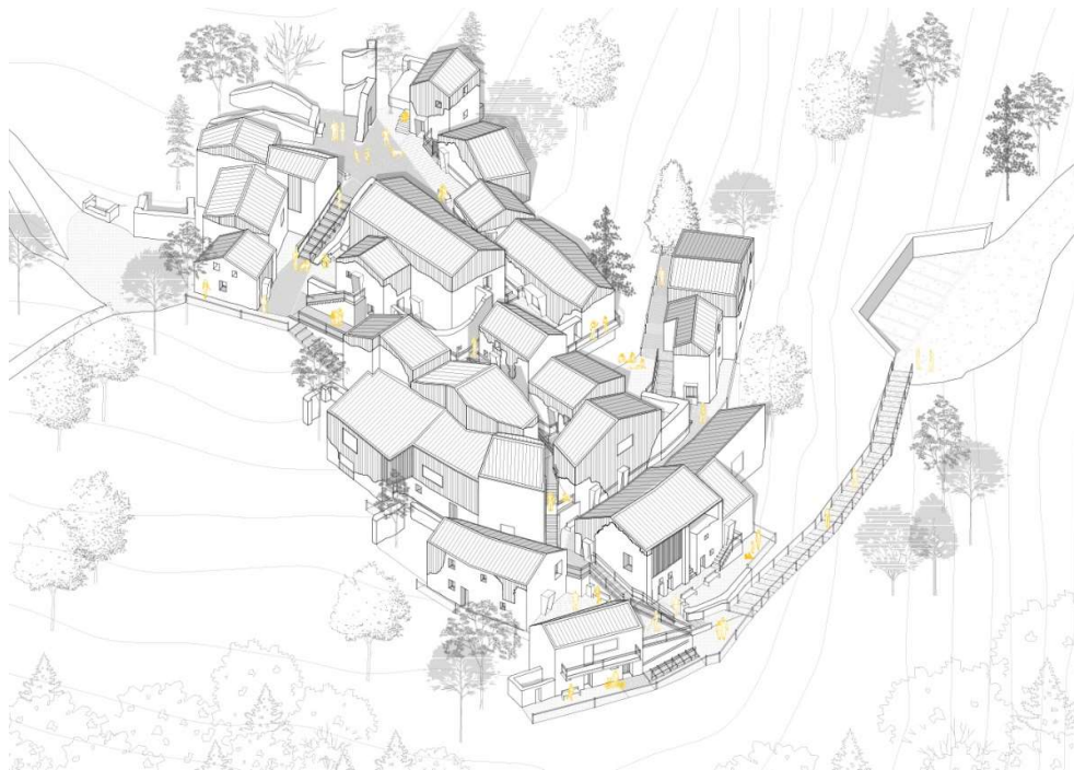
Figura 2: Assonometria di progetto della borgata Querio