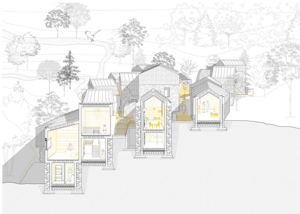
Figura 3: Sezione prospettica di progetto della borgata Querio