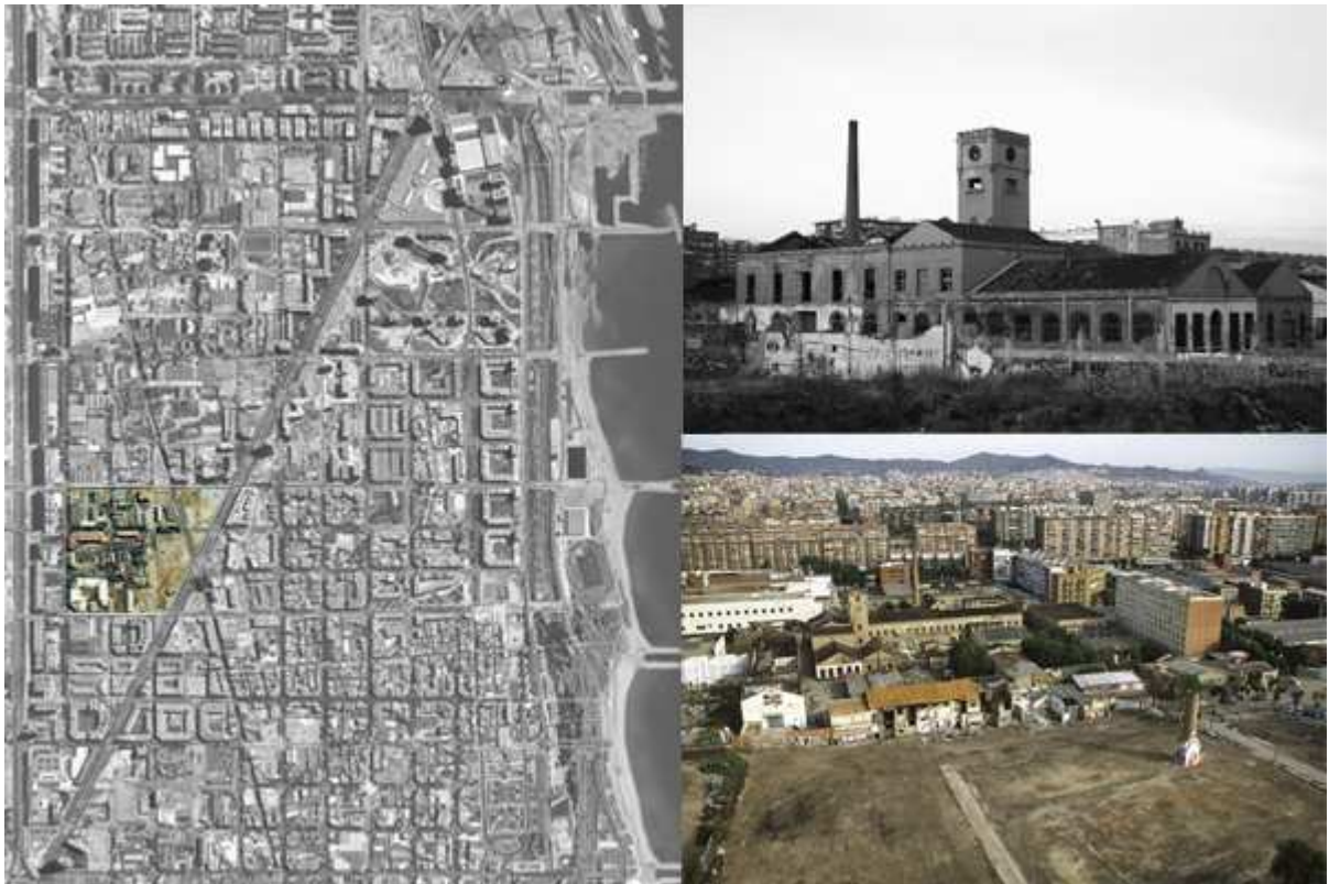
Inquadramento della Fabbrica all'interno del Poblenou, facciata principale e fotografia aerea prima della realizzazione del Parc Central sul suo fronte

L'obiettivo della tesi è verificare se sia possibile la riappropriazione degli spazi abbandonati che appartengono alla città di Barcellona, ma che hanno perduto il loro significato originario senza averne acquisito un altro: sono le aree industriali dismesse, zone di espansione nelle quali la rendita fondiaria è l'unica delle ragioni di pianificazione e perciò divenute gli ambiti per la nuova riqualificazione urbana. La proposta progettuale si situa nell'ex quartiere industriale di Barcellona, il Poblenou, per il quale nel 2000 è stato approvato un piano di riqualificazione gestito dalla società 22@.