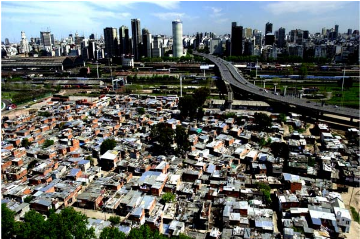
Contrasto tra la Villa 31 e lo skyline della città di Buenos Aires

La questione abitativa argentina si presenta oggi in maniera molto più complessa e contraddittoria rispetto al passato: estrema povertà, accelerata urbanizzazione informale e frammentazione socio-territoriale sono alcuni degli aspetti costitutivi dell'attuale deficit urbano, che si manifesta con durezza sul territorio metropolitano di Buenos Aires, in contrapposizione all'immagine "primomondista" che la capitale ha ed offre di sé stessa.