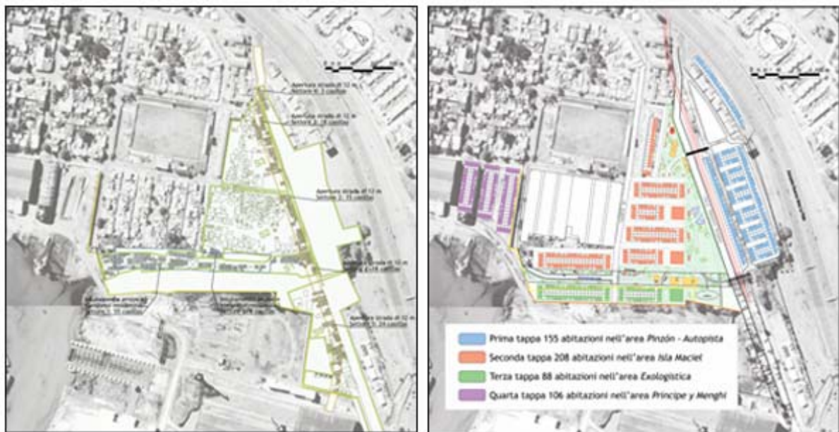
Planimetria di Villa Maciel con il numero di case da riubicare e Masterplan generale del Programa de Urbanización de Villa Maciel

L'obiettivo di questa tesi è valutare quali siano le condizioni che i programmi di abitazione sociale devono contemplare, al fine di garantire soluzioni efficaci e durature. In primo luogo, è necessario considerare la dimensione urbana, con il fine di "realizzare città" e non solo costruire abitazioni: progettare spazi pubblici, attrezzatura educativa, sanitaria, culturale e ricreativa, per articolare il consolidamento di piccole centralità; allargare la rete di infrastrutture di servizio; definire una buona accessibilità; pianificare strategie per la generazione di impiego; riflettere sulla localizzazione dei nuovi quartieri, secondo una strategia di sviluppo urbano; studiare tipologie abitative che contemplino il modello di città che generano e che considerino le distinte realtà climatiche, sociali e culturali del luogo dove saranno realizzate.