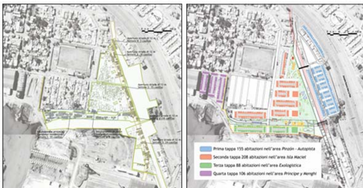
Plano general de la condición inicial de Villa Maciel y Masterplan de las obras en ejecución por parte de la Municipalidad de Avellaneda

El objetivo de esta tesis es evaluar cuales son las condiciones que los programas de vivienda social deben observar para garantizar soluciones eficaces y duraderas. Proyectar espacios públicos, equipamiento educativo, sanitario, cultural y recreativo para articular la consolidación de pequeñas centralidades; ampliar la red de infraestructuras de servicio; definir una buena accesibilidad; planear estrategias de generación de empleo; pensar la localización de los nuevos barrios, según una estrategia de desarrollo urbano de las ciudades dónde se implantan; estudiar tipologías de vivienda que contemplen el modelo de ciudad que generan y que consideren las distintas realidades climáticas, sociales y culturales, son todas tareas fundamentales que permiten abarcar la dimensión urbana, para “realizar ciudades” además de construir viviendas.