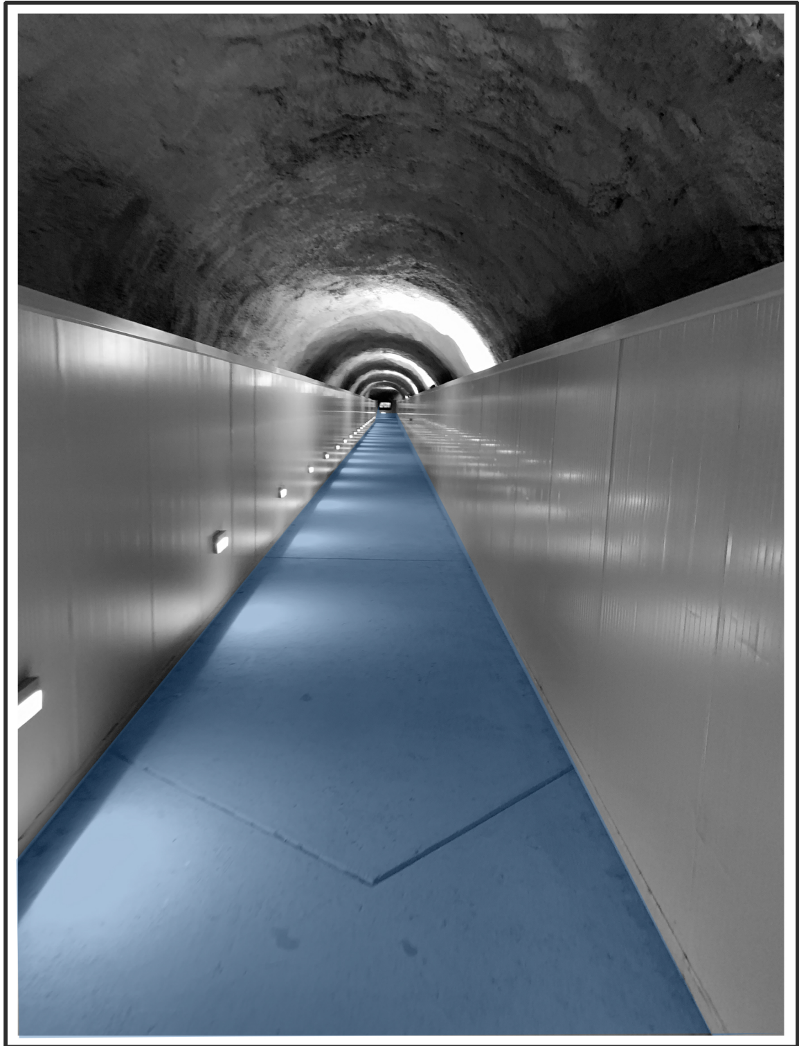
Fotografia dell'interno del tunnel di collegamento