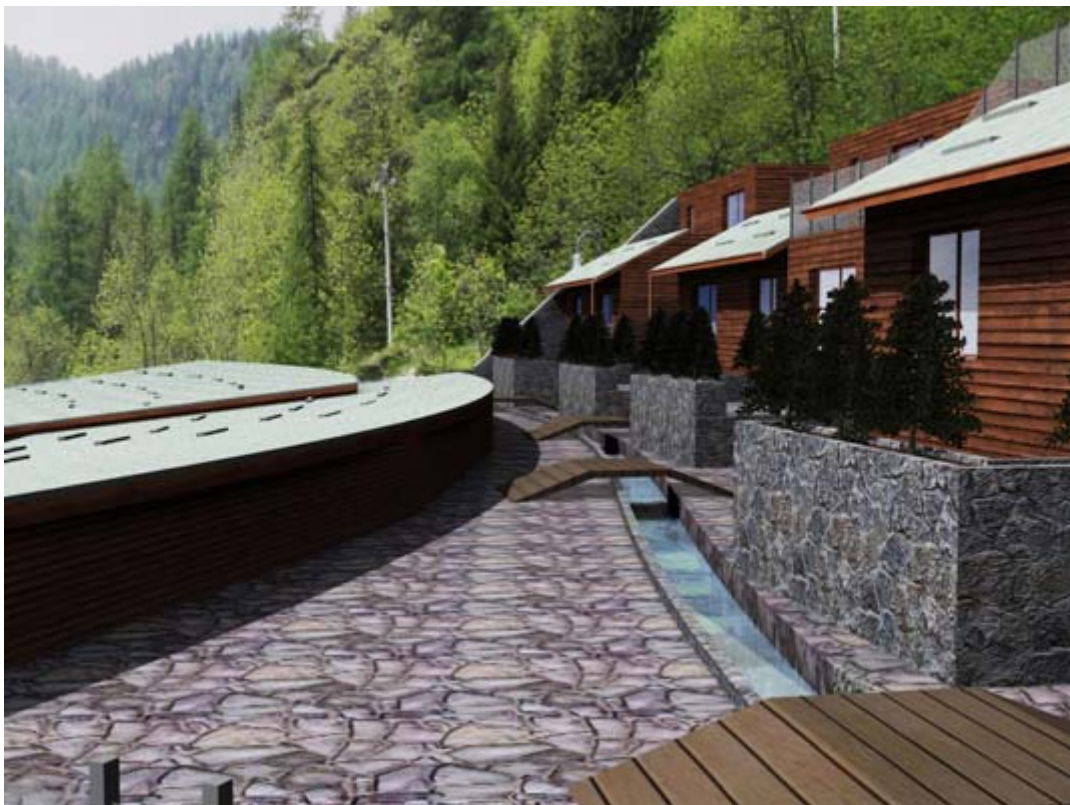
Vista delle abitazioni private sopra il canale storico

Al piano superiore invece, la destinazione d'uso cambia, diventa privata, con un suo accesso dalla strada soprastante. Si sono predisposti appartamenti da 80-100 mq al primo livello, mentre al secondo si sviluppano monolocali, molto ben adatti per case in affitto.