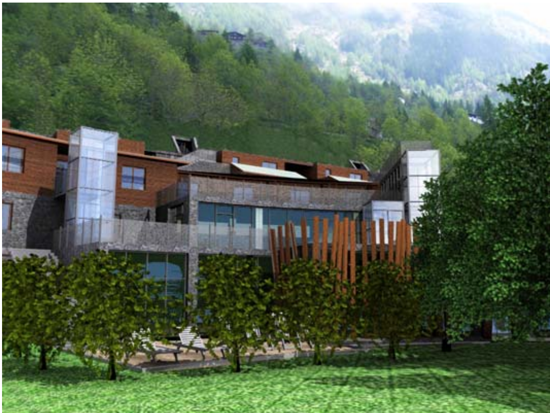
Vista frontale della struttura alberghiera

La struttura pubblica, in linea con le tendenze contemporanee, completa l'offerta turistica dell'area sportiva con un centro SPA, un centro benessere con piscina, massaggi, sauna e palestra. Lo SPA viene organizzato al piano terreno, e si articola intorno ad una piscina centrale. Questa esce all'esterno dell'edificio e permette ai clienti, immersi nell'acqua fino alle spalle, di uscire all'esterno sedendosi comodamente sull'apposita seduta.