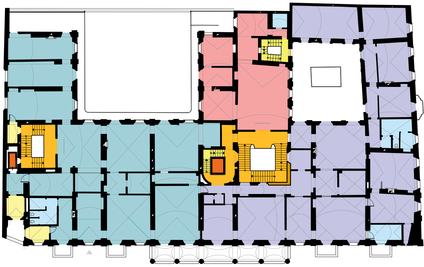
Keyplan Piano Primo