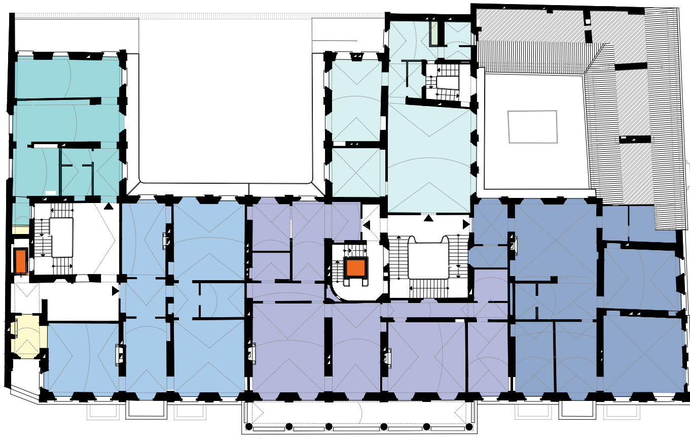
Keyplan Piano Secondo