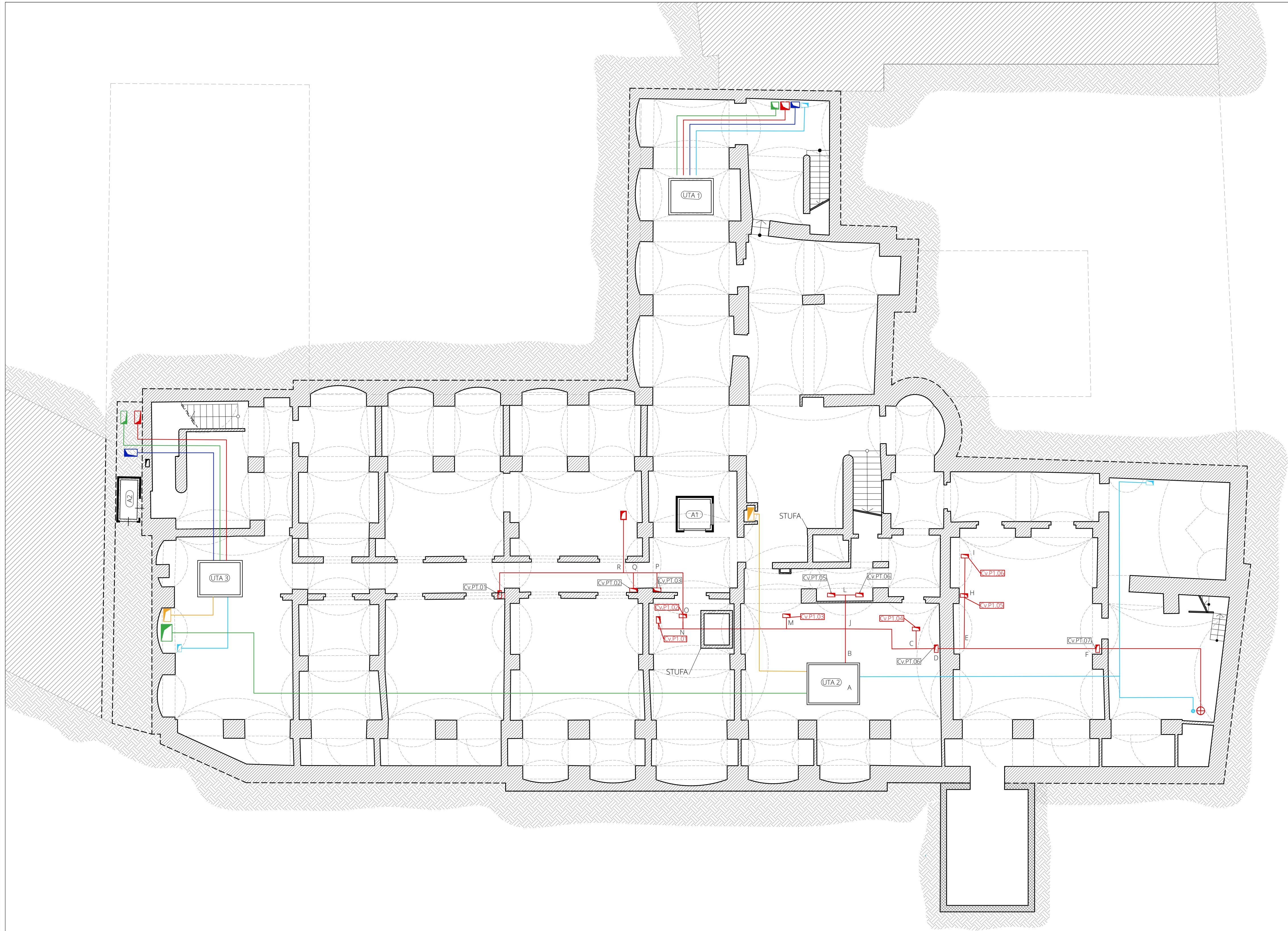
Keyplan Piano Terra