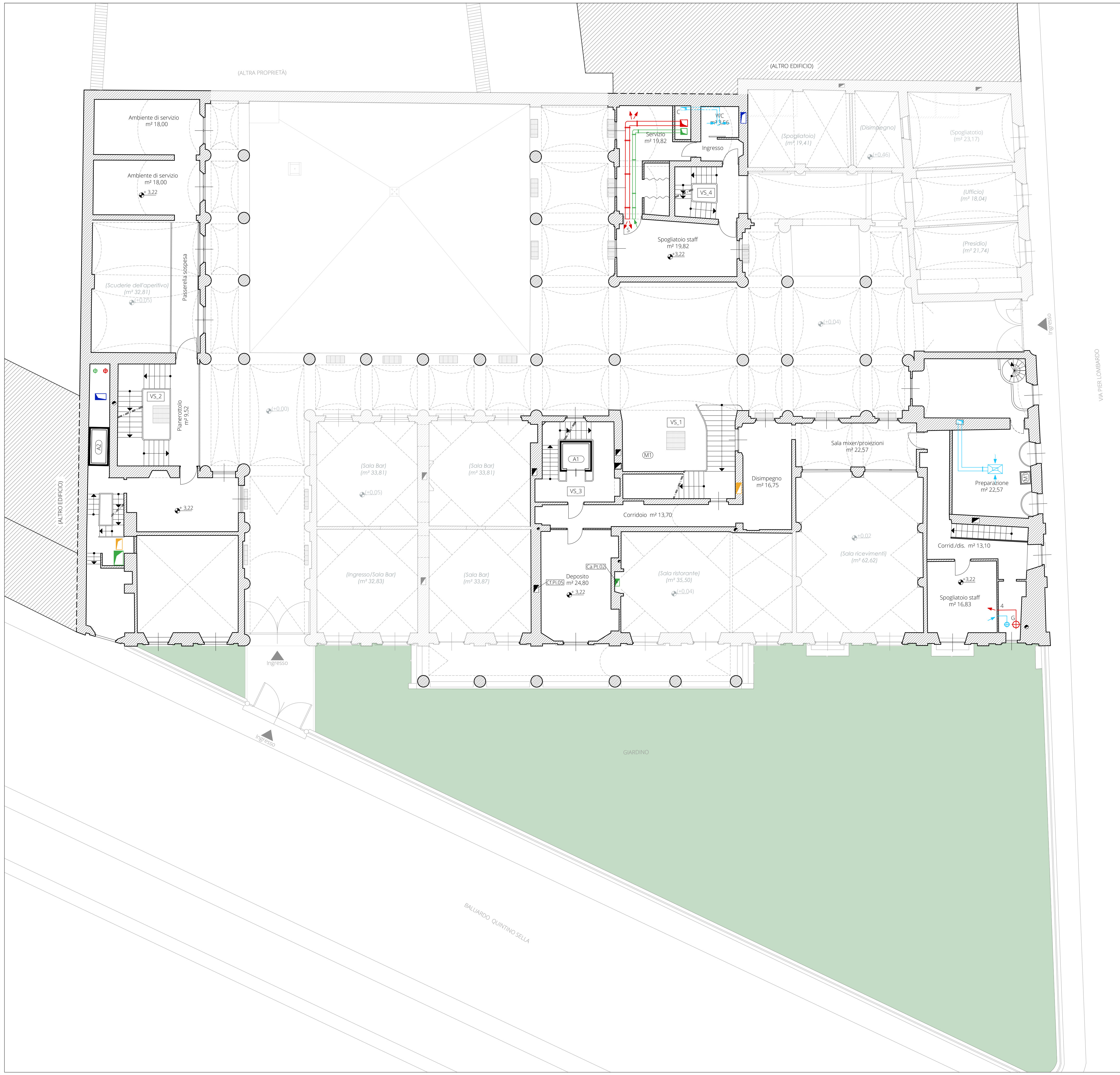
Keyplan Piano Terra