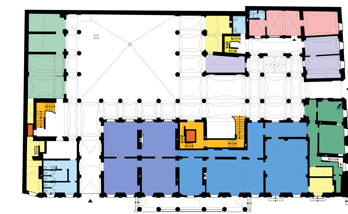
Keyplan Piano Terra