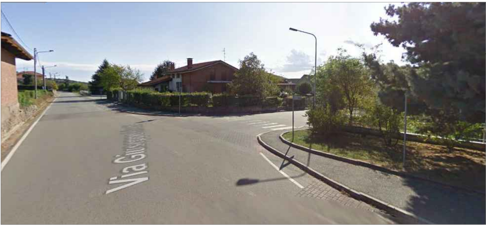
Vista attuale accesso su via Getta