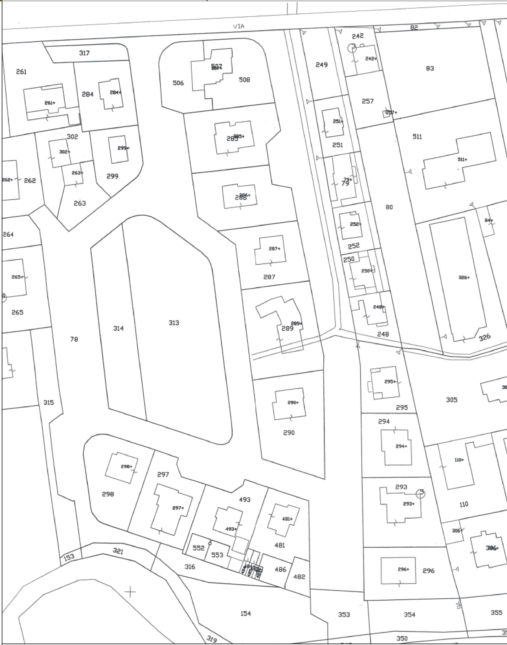
Mappa catastale scala 1:1000