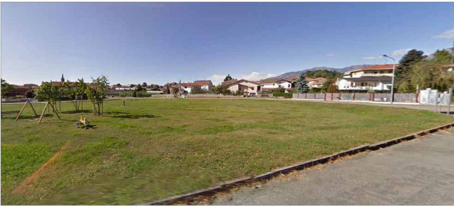
Vista attuale del lotto da Nord-Est