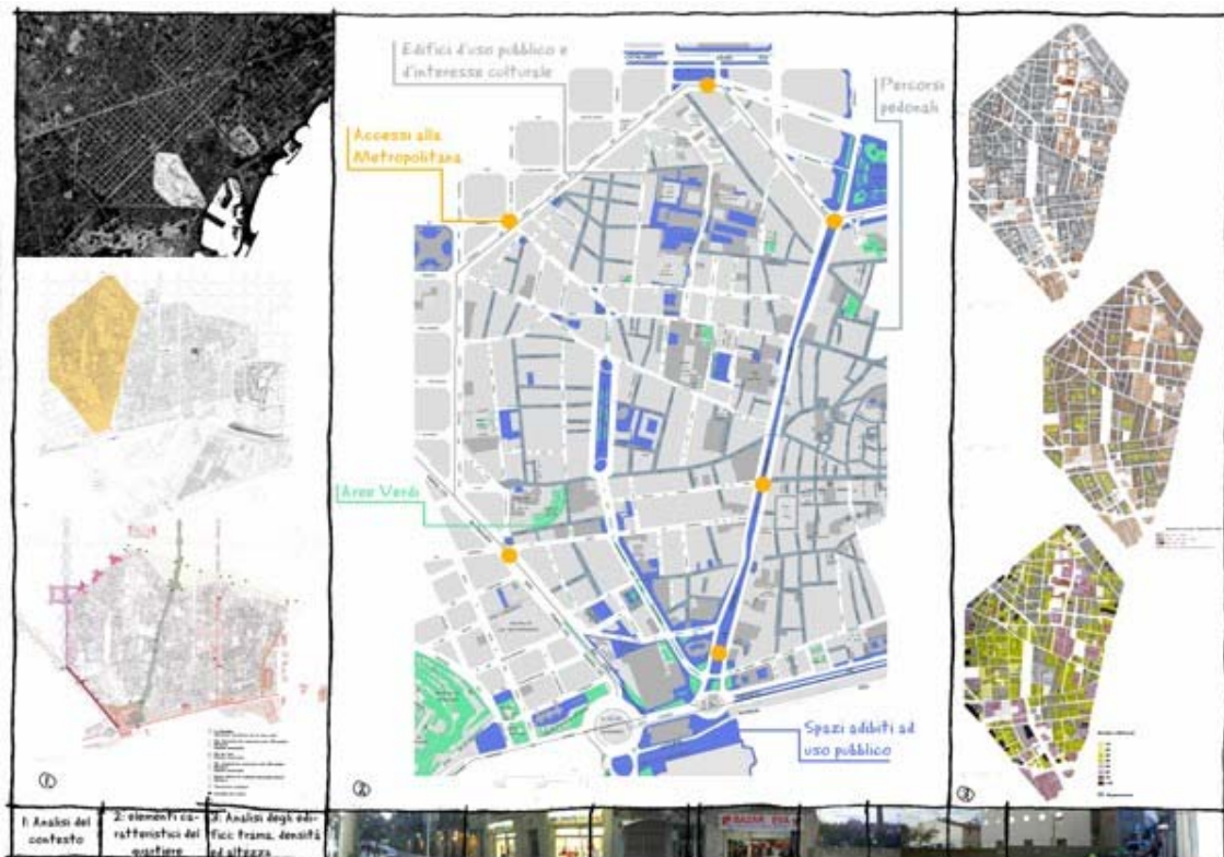
Analisis de los elementos morfologicos del Raval

Todas las grandes operaciones actuales pueden resultar menos eficaces si viene a faltar un adecuado programa de intervención por el casco antiguo y, en particular, por aquellas áreas menos representativas, muy degradadas y fuera de los circuitos comerciales y turísticos que se encuentran sobre todo en el barrio del Raval.