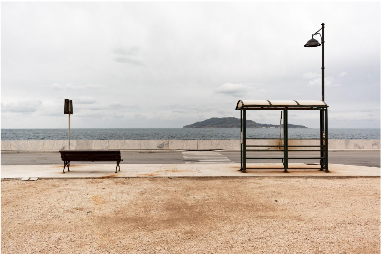
Immagine 3. Foto tratta dal progetto fotografico.

Per ulteriori informazioni contattare: Mauro Fontana , maurofontana93@gmail.com