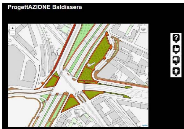
Fig.51 Interattività: visualizzazione progetto Amministrazione Comunale