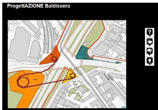
Fig.52 Interattività: visualizzazione progetto di tesi