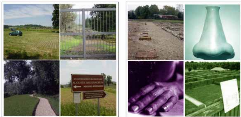
Elements for an Immediate Experience, elements for an Overrefined Experience

In the third and last part of the work, after the analysis of the situation on the Piemonte territory, and with the intent to characterize the main points of a plan about accessibility for archaeological areas, the work focuses on the constitutive elements of these structures.