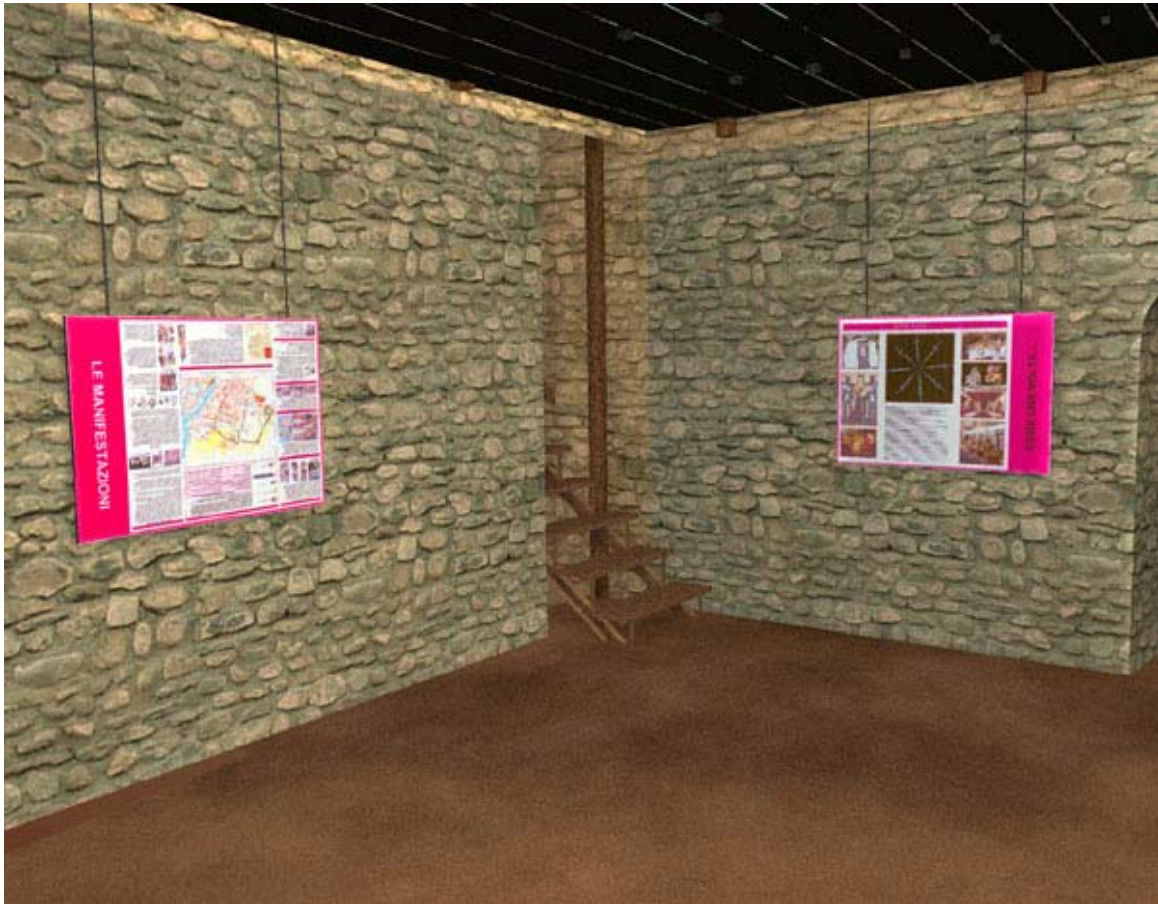
Ricostruzione virtuale di un allestimento delle carceres realizzata con Alias Studio 3D

Poiché l'anfiteatro è già attualmente sede di manifestazioni folkloristiche e culturali come il Palio dei Borghi , ho cercato di rendere maggiormente idonee le strutture dell'edificio per tale utilizzo con la progettazione di un palco e di sedili removili. Ho proposto l'inserimento, sulle gradinate, di cuscini mobili, componibili ed asportabili che si possano risistemare di volta in volta per ogni esigenza, evitando così di deturpare l'immagine dell'anfiteatro con stabili sovrastrutture moderne.